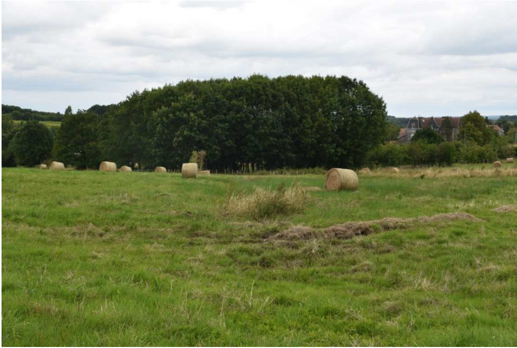
Parcelle ZL 101. Photos prise en juin 2020. Photos 3