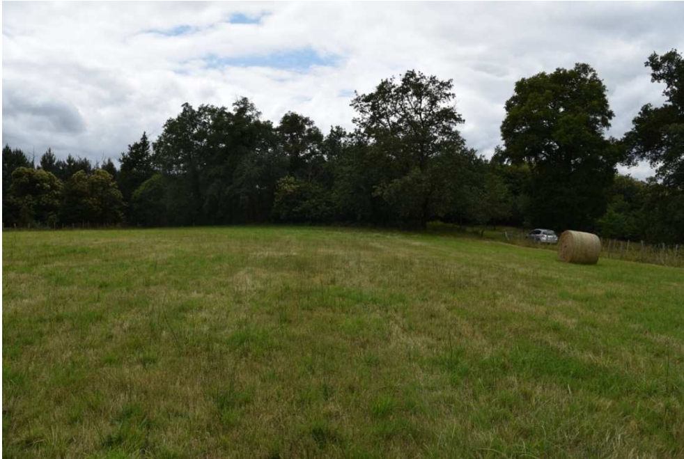
Parcelle D 70 – Photos prise en juin 2020. Photos 1