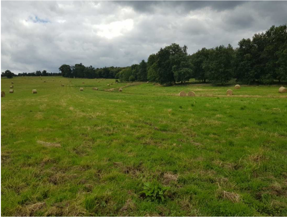
Parcelle D 88 et D 983. Photo prise en juin 2020. Photo 2