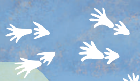
« Héron pourpré »

Les caractéristiques de l'étang favorisent une végétation exubérante, qui compte environ 500 espèces, utilisée par une faune très diversifiée avoisinant 900 espèces. Près de 250 espèces d'oiseaux ont été inventoriées ici, soit 40% des oiseaux vus en France, ou encore 45 espèces de libellules totalisant 75% des espèces présentes en Limousin. Toutes profitent de cette zone humide dont la limite entre terre et eau se déplace au gré des variations naturelles du niveau de l'étang, créant des conditions écologiques très particulières.