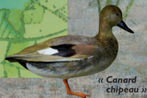
« Canard chipeau »