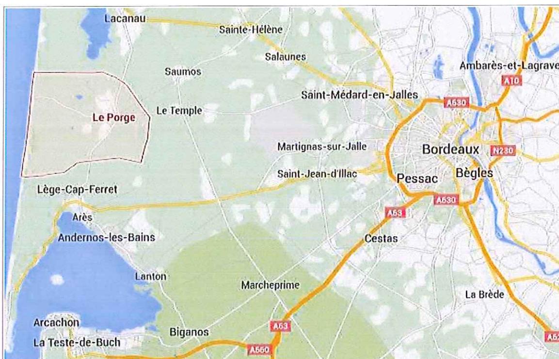
Localisation de la commune du Porge

Le Porge est une commune littorale située dans le département de la Gironde, à environ 50 km de l'agglomération bordelaise. D'une superficie de 149 km 2 , elle longe l'océan Atlantique sur sa partie ouest et est limitrophe des communes de Lège-Cap-Ferret, au Sud, et de Lacanau, au Nord.