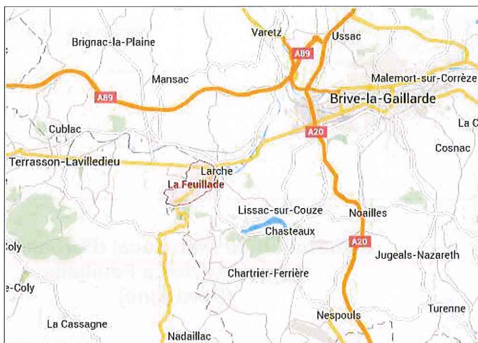
Localisation de la commune par rapport à l'agglomération briviste

La commune de La Feuillade est située dans le département de la Dordogne, à la frontière du département de la Corrèze, et à environ 60 km de Périgueux et 15 km de Brive-la-Gaillarde.