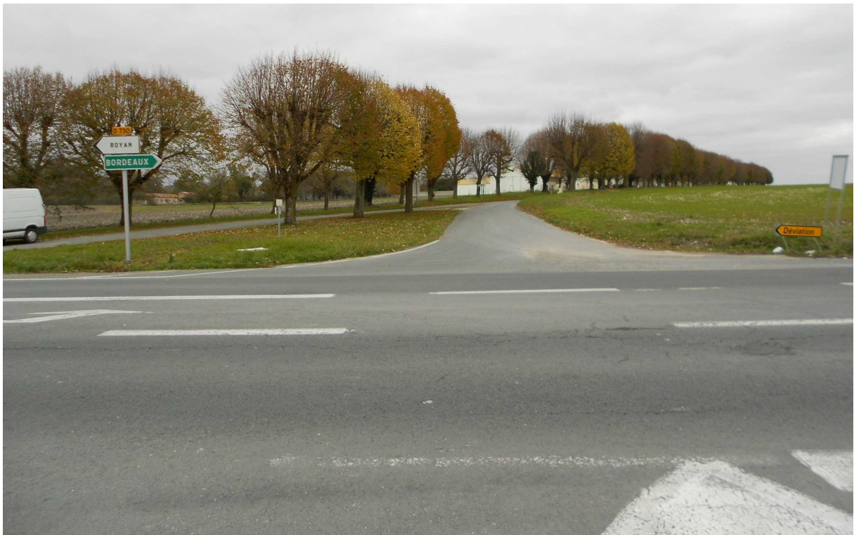
prise de vue 02/12/2013