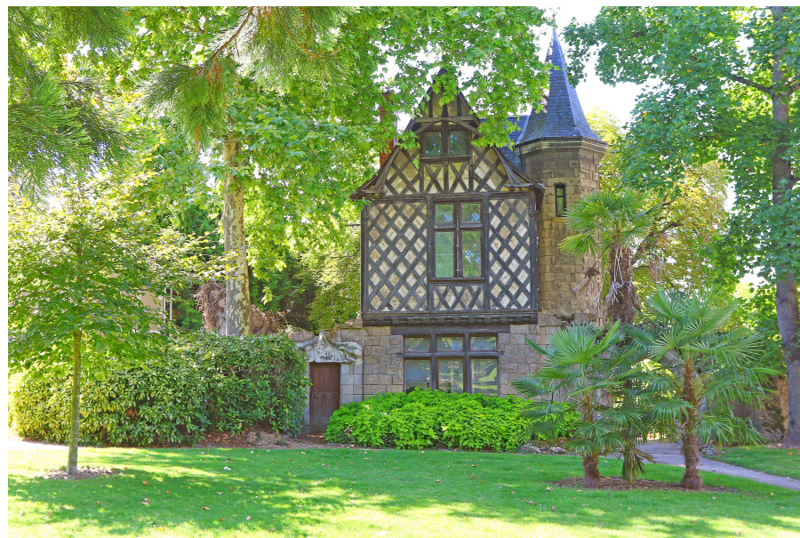
Un local original et facilement identifiable auprès des usagers, situé en plein cœur de Châtelleraut