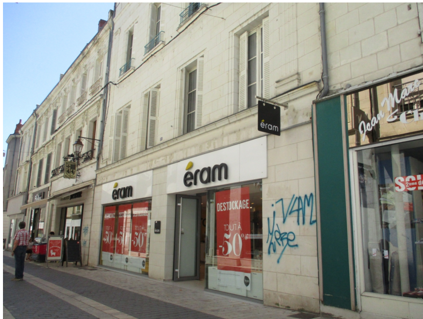
Façade de l'immeuble avant travaux