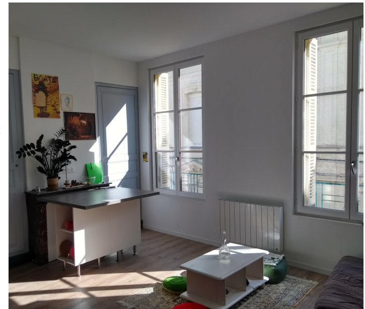
Immeuble après travaux