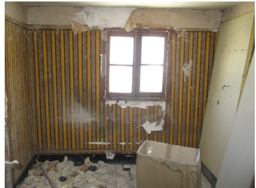
Intérieur des étages