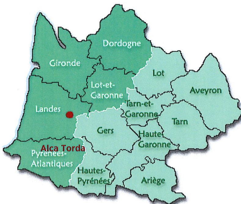
Situation géographique du centre Alca Torda

De part sa situation géographique, le centre peut recevoir des appels téléphoniques pour demande d'intervention de six départements, la carte ci-dessus parle d'elle-même et met en évidence les déplacements possibles concernant notre activité.