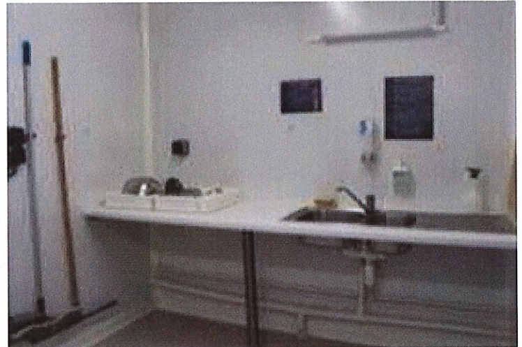
Lavage et désinfection