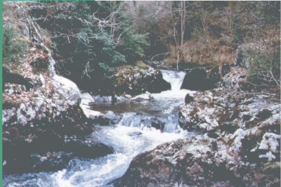
Le cours torrentueux du Chat-Cros

Canton : EvauX-les-Bains Commune : EvauX-les-Bains Superficie : 51 ha Date de protection : 17/03/1994