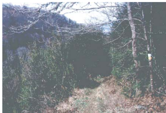
Un sentier à travers la coulée de buis

Les ruines du château de la Roche Aymon, situées en amont de la retenue d'eau, sont fortement dissimulées par la végétation. Certes, elles n'appartiennent pas au périmètre du site, mais elles méritent tout de même d'être mises en valeur.