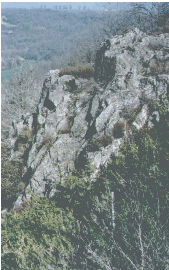
Les falaises rocheuses

descendaient certainement dans la vallée.