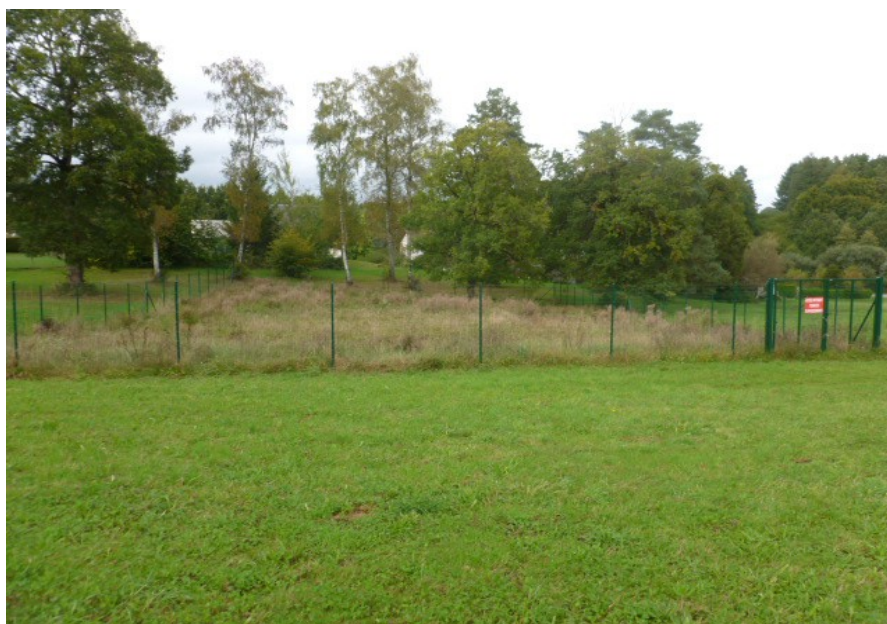
Zone où le désordre s'est produit – clôture

Un désordre type affaissement s'est produit le 12 octobre 2012 au niveau de la zone nord des anciens travaux miniers et dans le secteur des travaux de confortement effectués en août 2012. Le rapport d'incident transmis fait état d'un ensemble de causes : fortes pluies les jours précédents, possible fragilisation de la zone par la campagne de sondage 6 mois plus tôt et présence d'un montage non remblayé lors du réaménagement.