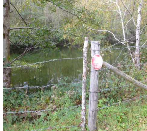
Accès aménagé pour les services de secours (portail dédié – lieu de prise d'eau prévu)

Le point de surverse de la MCO existe mais ne coule pas. Toutefois, Areva annonçait par courrier du 23 février 2010 des analyses complémentaires au niveau des sédiments en aval du point de surverse - les résultats sont à transmettre.