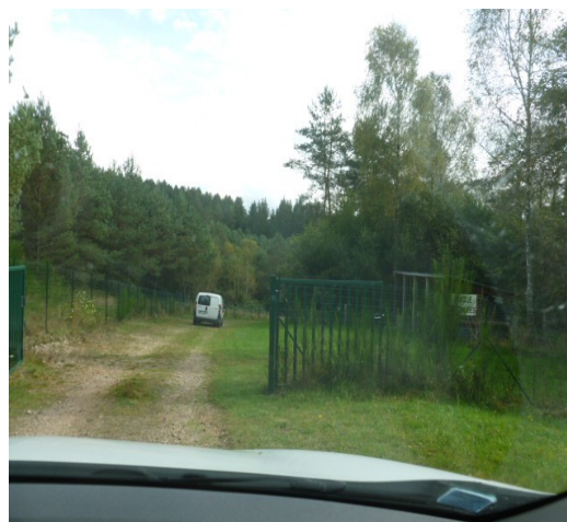
2 ème clôture

Le site est bien entretenu ; la MCO dispose d'un accès en pente douce.