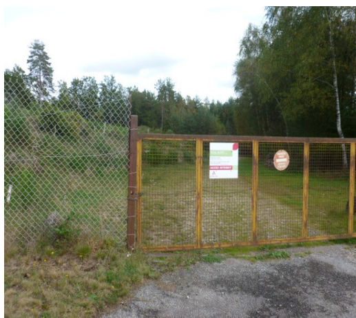
1 er portail d'accès