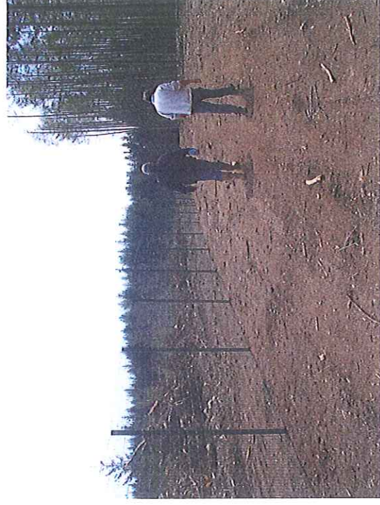
Vue de la clôture coté Ouest de la MCO