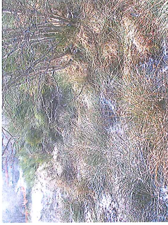
Zone marécageuse source à capter et à détourner de son écoulement dans la MCO