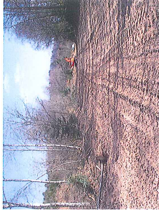
Vue de la piste allant de la MCO vers le carreau