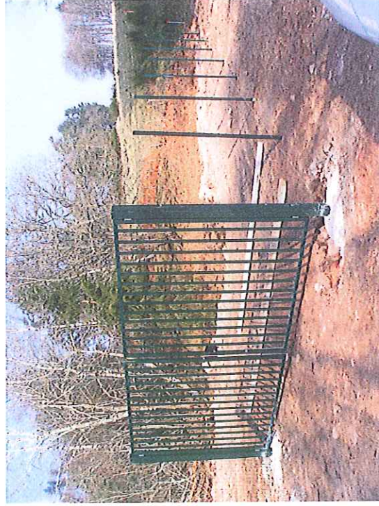
Vue de la pose du portail ( entrée de la MCO )