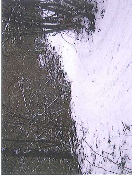
Entrée sur le carreau d'Hyverneresse