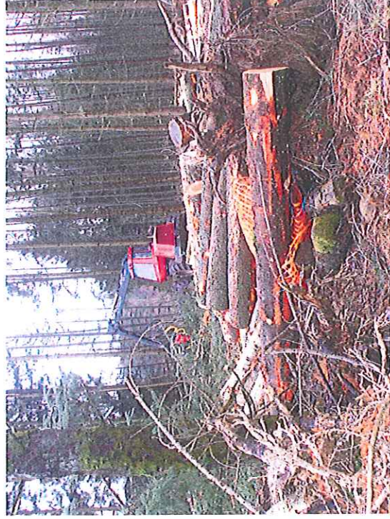
Vue de la zone d'abatage du bois de sapins Côté Ouest de la MCO