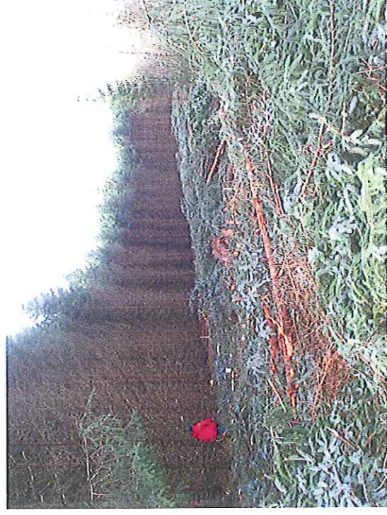
Vues de la zone d'abatage du bois de sapins Côté Sud de la MCO (partie du terrain à acquérir)