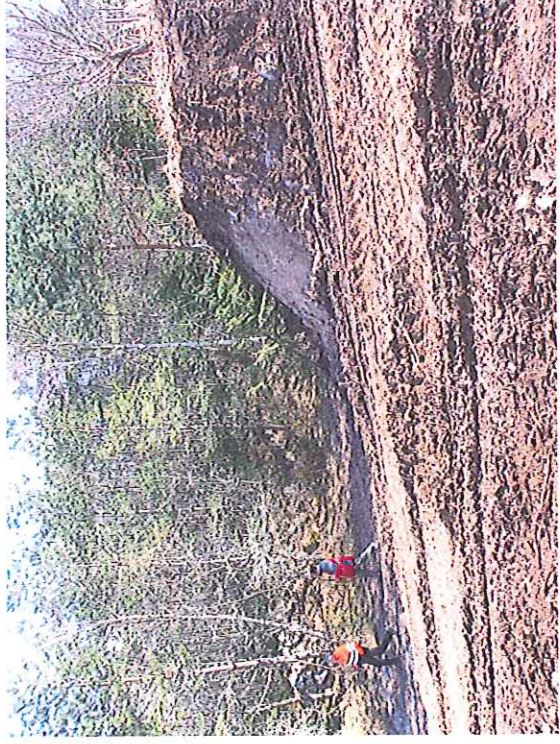
Vue de la rampe d'accès