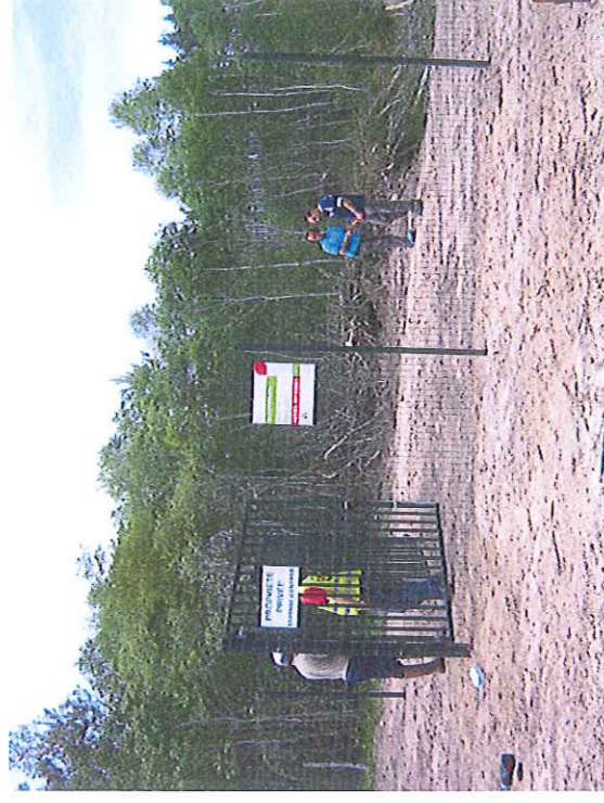
Vue du portail et des panneaux signalétiques