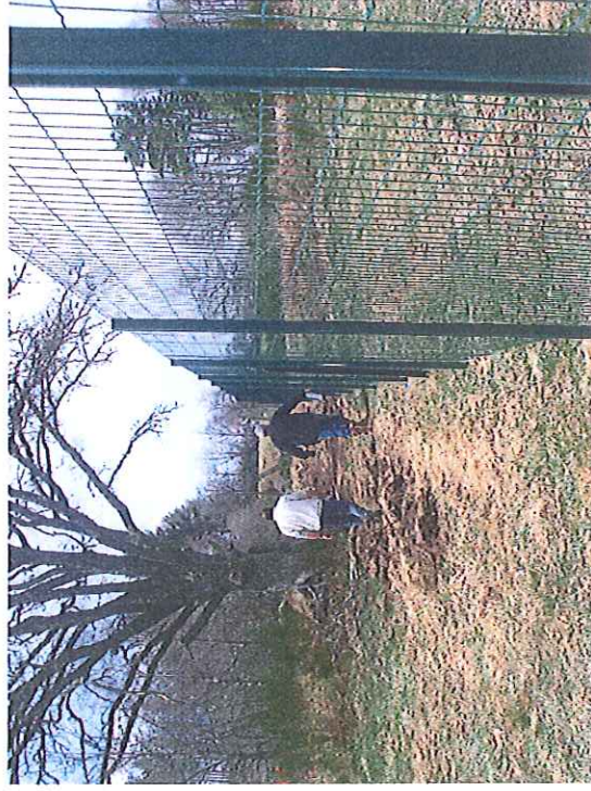
Vue de la clôture coté Nord de la MCO