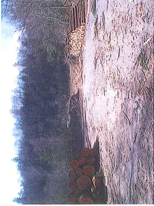
Vue de l'ouverture du merlon pour accès au Carreau et zone de stockage du bois