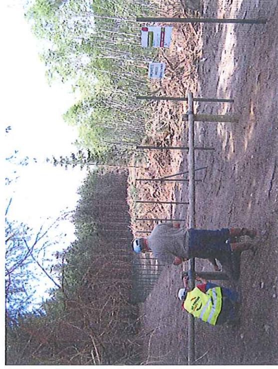
Vue de la barrière coulissante fermant l'accès Au passage de 4 m contournant la clôture