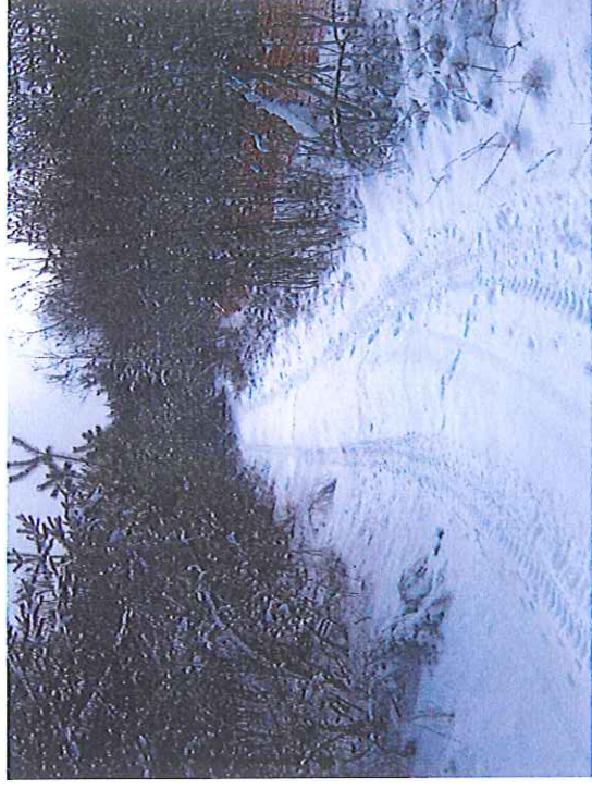
Piste bordant la MCO et la Verse