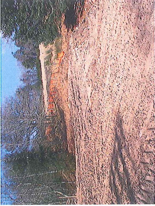
Vue du passage busé, emplacement du portail d'entrée de la MCO et accès au contournement de la clôture