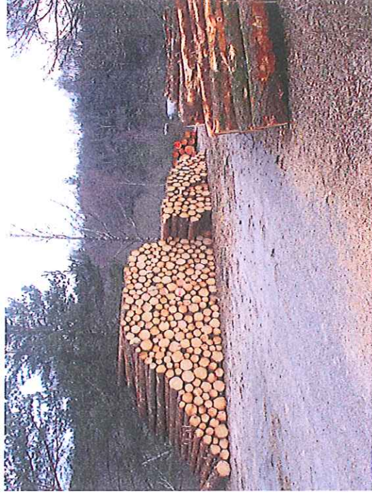
Zone de stockage des bois