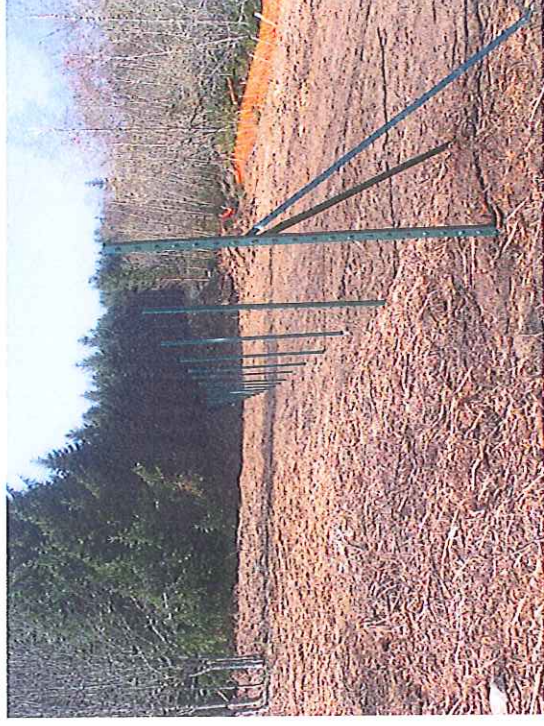
Vue de la clôture coté Sud de la MCO