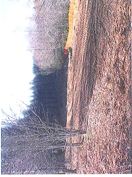
Vue de la zone Sud d'implantation de la clôture