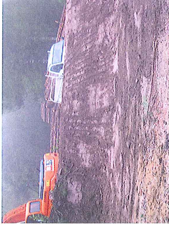
Vue du merlon de l'entrée reconstitué