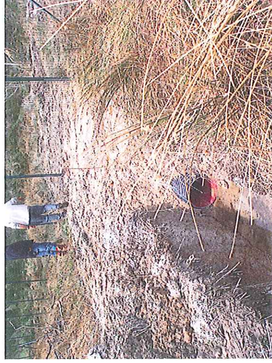
Captage de la source, passage busé sous la clôture coté Nord MCO