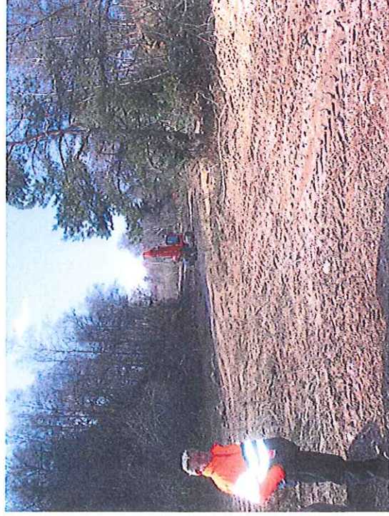
Vue de la piste allant vers la MCO