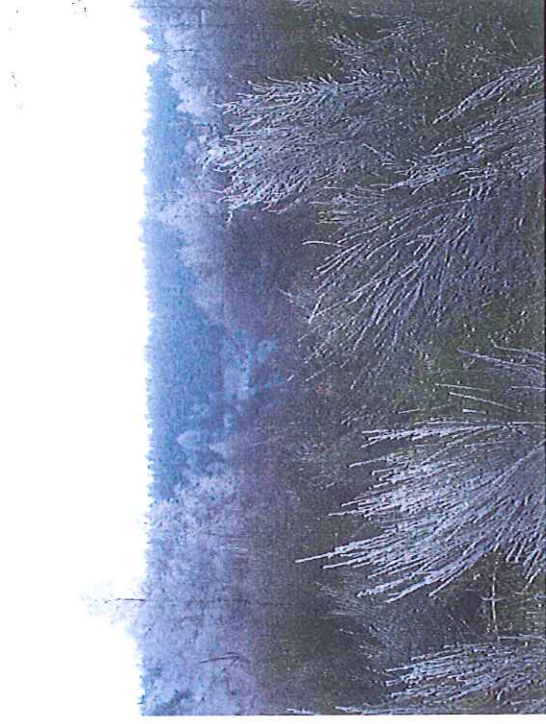
Vue vers le Sud du bois de sapins à abattre en Arrière plan de la MCO