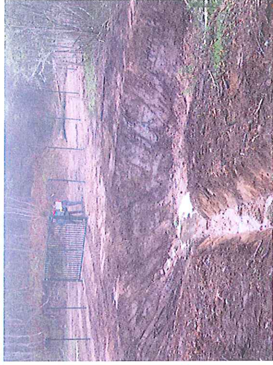
Vues du fossé de dérivation des eaux de la source