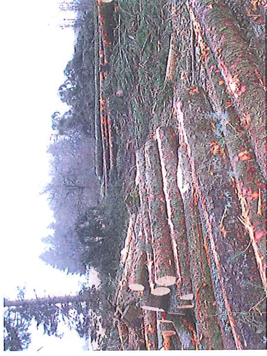
Même zone après abatage