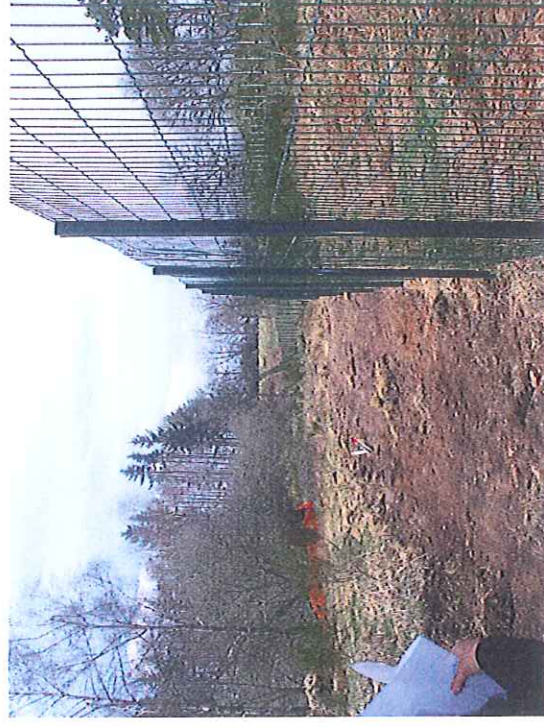
Vue de la clôture coté Nord de la MCO