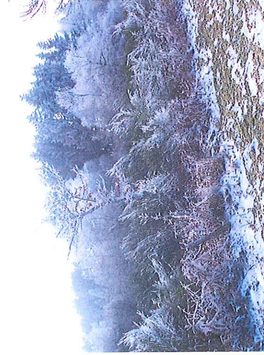
Vue vers l'Ouest du bois de sapins à abattre