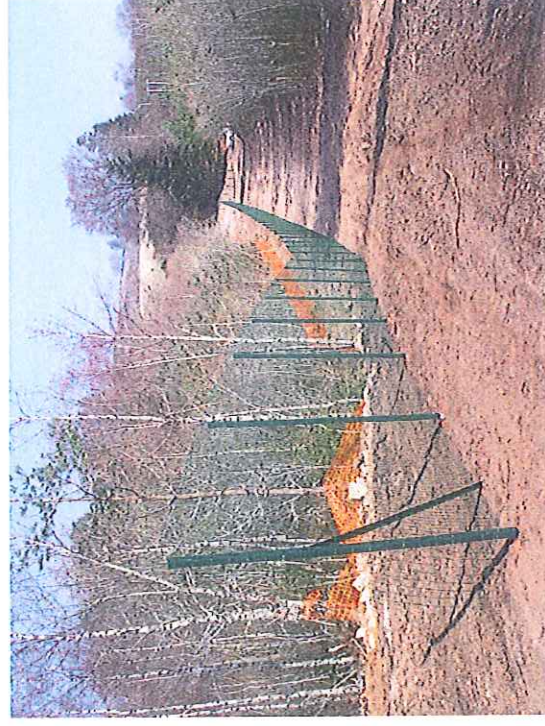
Vue de la clôture coté Est de la MCO bordant Les verses à stériles