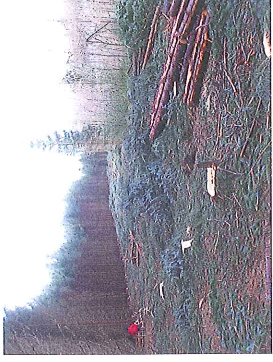
Même vue zone à dessoucher