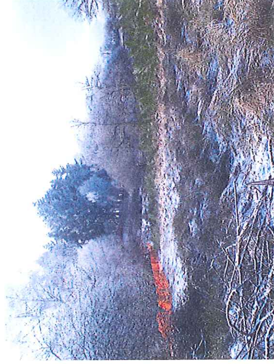
Vue vers l'Ouest du passage de la clôture et du bois de sapins concerné à abattre