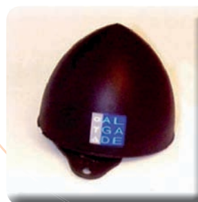
Dosimètre de la marque « ALGADE »