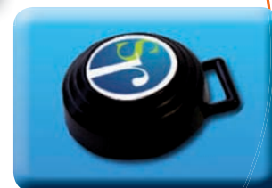
Dosimètre de la marque « PEARL »