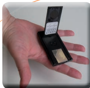
Dosimètre de la marque « DOSIRAD »

Pour savoir comment se procurer un détecteur et connaître la liste des sociétés ou organismes agréés, il convient de se rapprocher d'une agence régionale de santé (ARS) ou d'une délégation territoriale (antenne des ARS) existant dans chaque département (voir liste ci-dessous) :