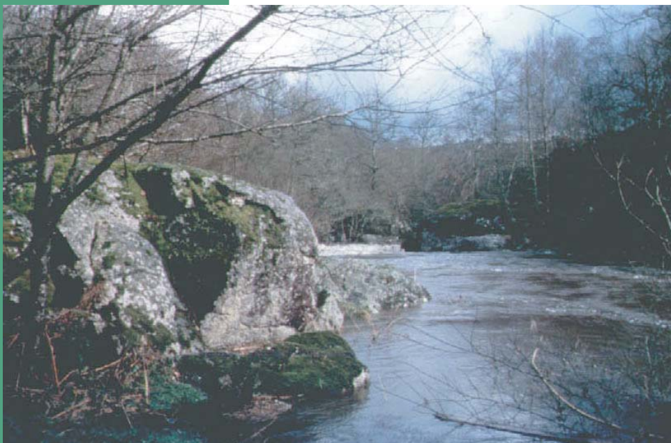
La Chute du Poirier

Superficie : 18 ha Date de protection : 30/04/1991