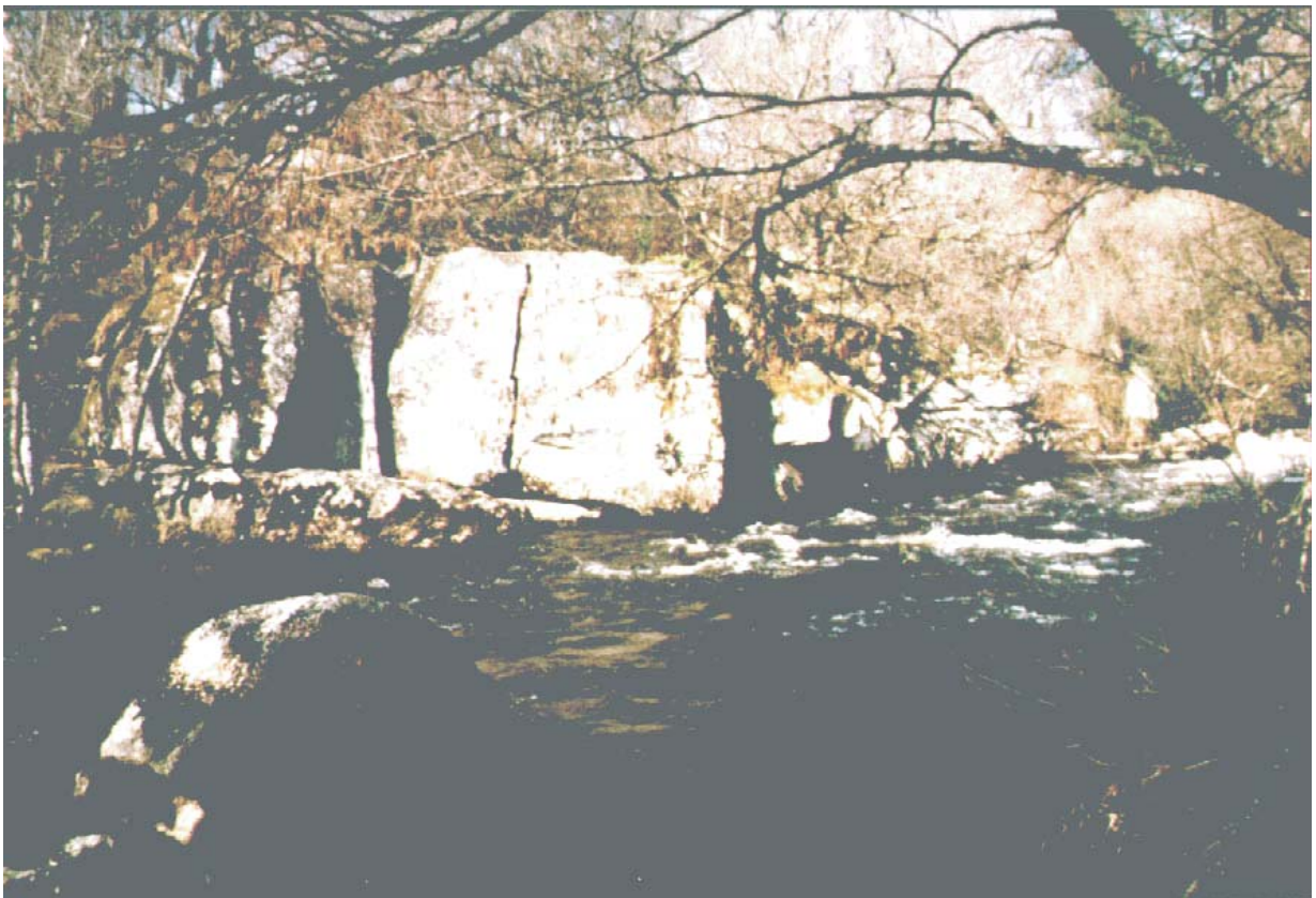
Gros blocs rocheux sur la rive du Taurion

En matière de signalisation, le site est indiqué seulement à l'intersection du CD 941 et de la route menant au village du Poirier. Un balisage n'est pas indispensable car la rivière se devine en contrebas. En revanche la direction de la chute pourrait être signalée près de l'ancienne scierie.