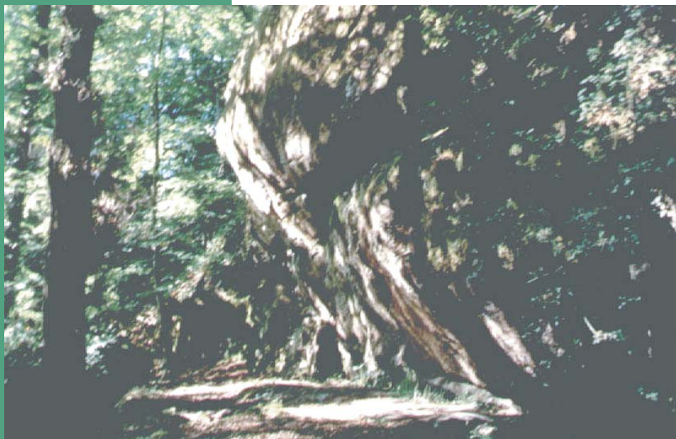
Les rochers du Pallet