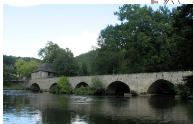
Le pont du Saillant

Marquis du Saillant. La légende veut que Poussin ait également fait un séjour au château.