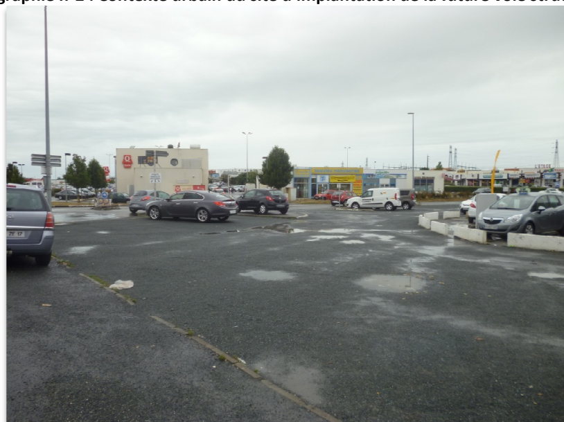
Photographie n°2 : Contexte urbain du site d'implantation de la future voie structurante