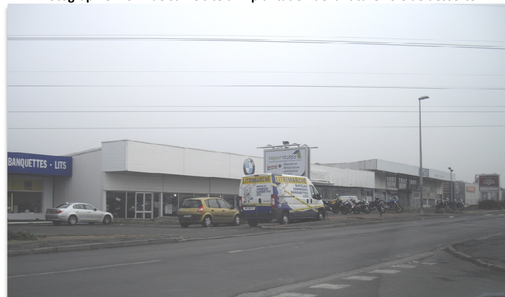
Photographie n°3 : Vue sur le site d'implantation de la future voie de desserte