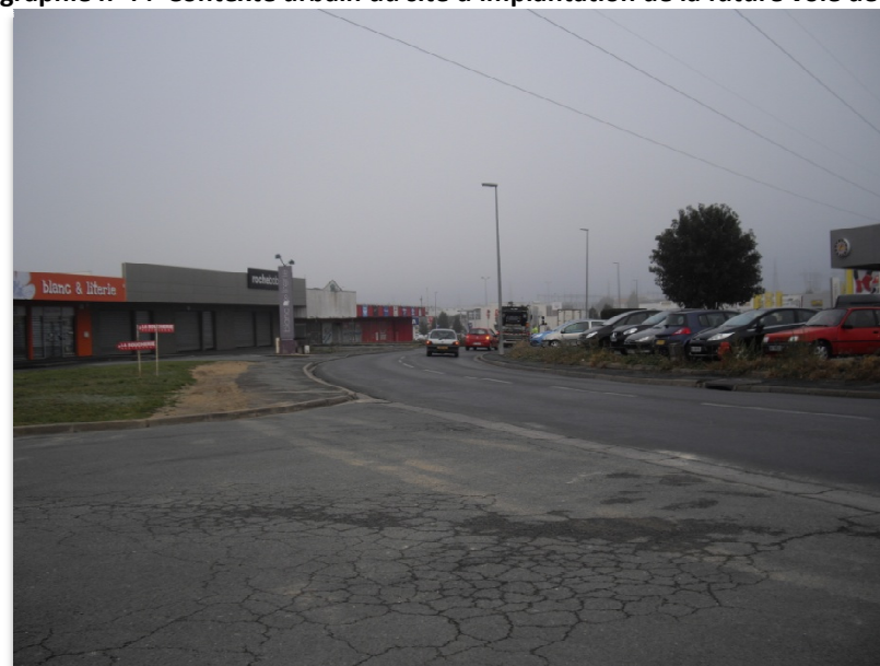
Photographie n°4 : Contexte urbain du site d'implantation de la future voie de desserte