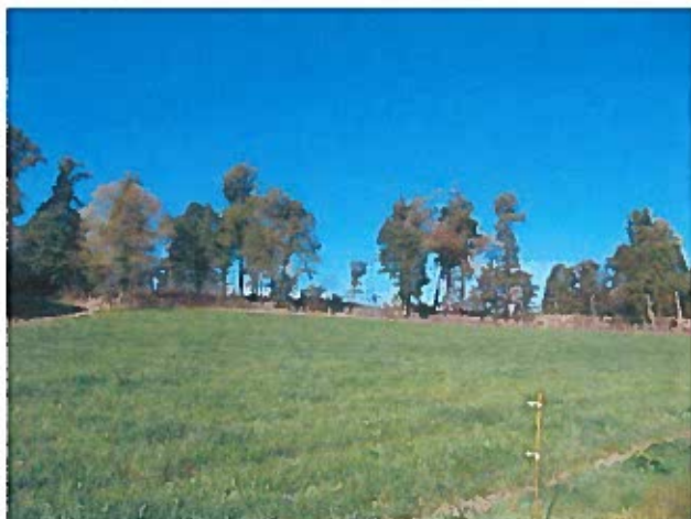
photo n°1: vue depuis le chemin privé présent du côté Sud-Est de la parcelle E 125