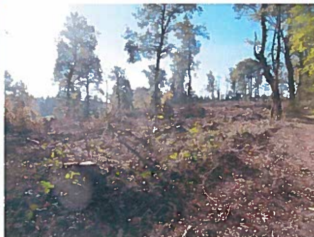
photo n°2: prise de vue de la parcelle E 125 faite depuis le Nord de la parcelle