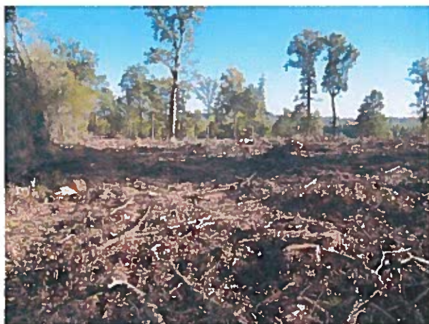
photo n°3: vue de la parcelle E 125 depuis le Sud-Ouest de la parcelle