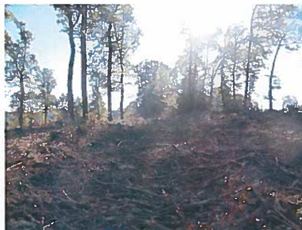
photo n°4: vue sur l'Est de la parcelle depuis le Sud-Ouest de la parcelle