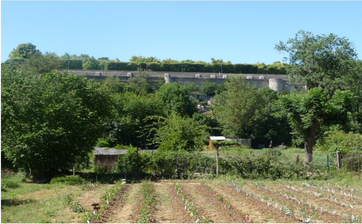
Photo 11 Vue du sud est vers le nord ouest à partir de la rue du Bas des Sables sur des jardins potagers, juste en face du parc de Blossac, dont on voit la frise des tilleuls taillés en rideau qui souligne les anciens murs des fortifications de Poitiers.