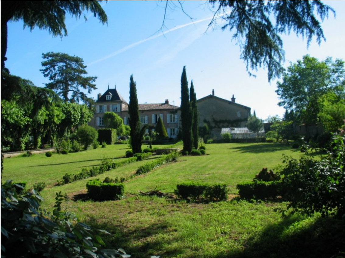
Photo 20 Vue sur une splendide propriété isolée dans la verdure en bordure du chemin du Bas des Sables.