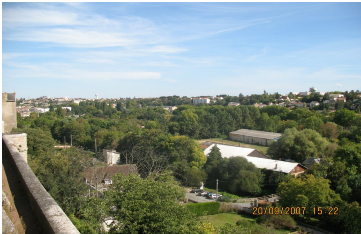
Photo 3 Vue à partir du rond point de Blossac-Rivaud sur la vallée du Clain : au premier plan en bordure du chemin du Tison une ancienne usine de fabrication de parquets utilisant la force motrice du Clain. Cette friche industrielle en zone inondable fait actuellement l'objet de réflexions pour sa réhabilitation tout à fait compatible avec le classement de site.