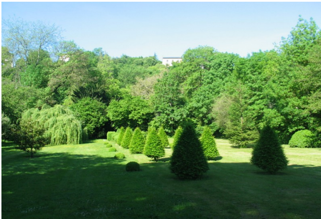
Photo 21 Vue à partir du chemin du Bas des Sables sur le jardin d'agrément planté d'ifs coniques, face à la belle propriété de la photo 20 ci-dessus.