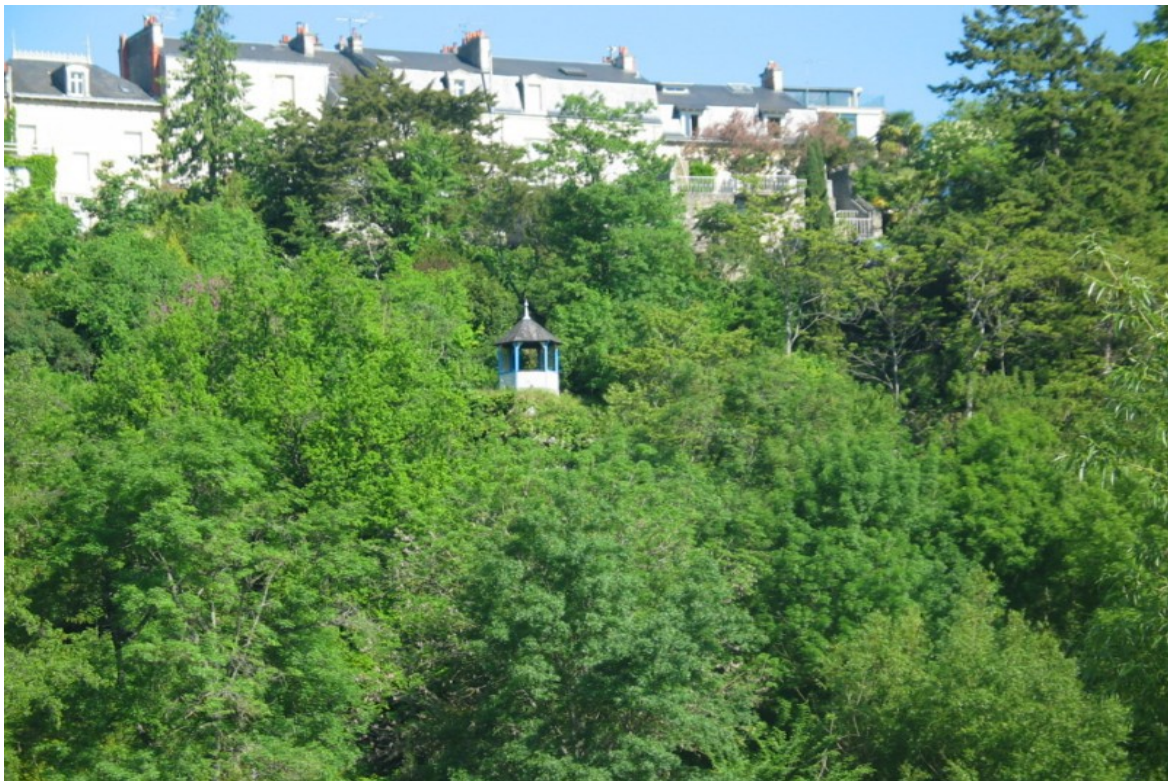
Photo 13 bis Vue sur le rebord de coteau très végétalisé et le trait de bâti bordant l'avenue de la Libération, dont la partie bâtie est exclue du classement.