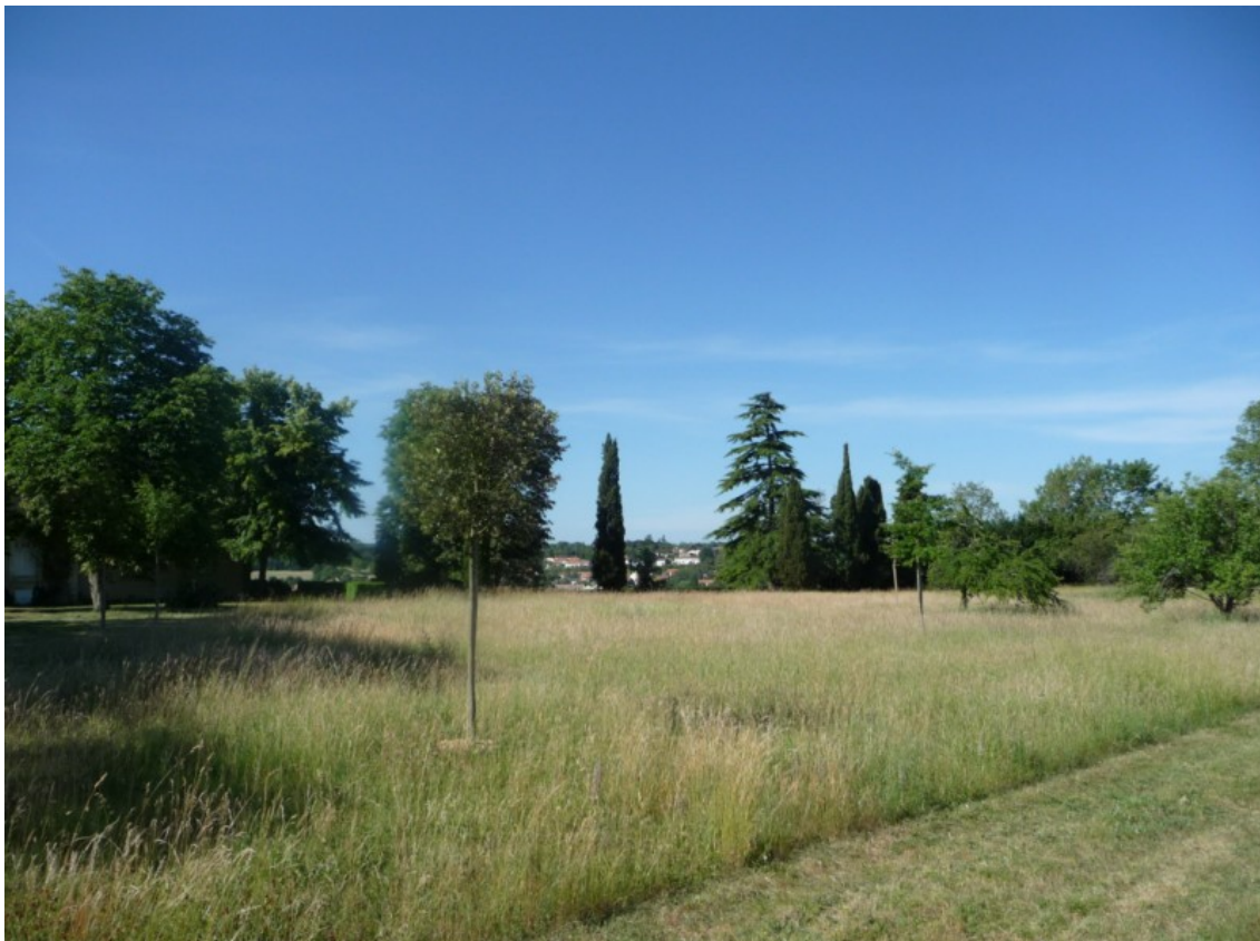
Photo 27 Vue de la partie ouest du parc de la Mérigote en bordure de plateau.