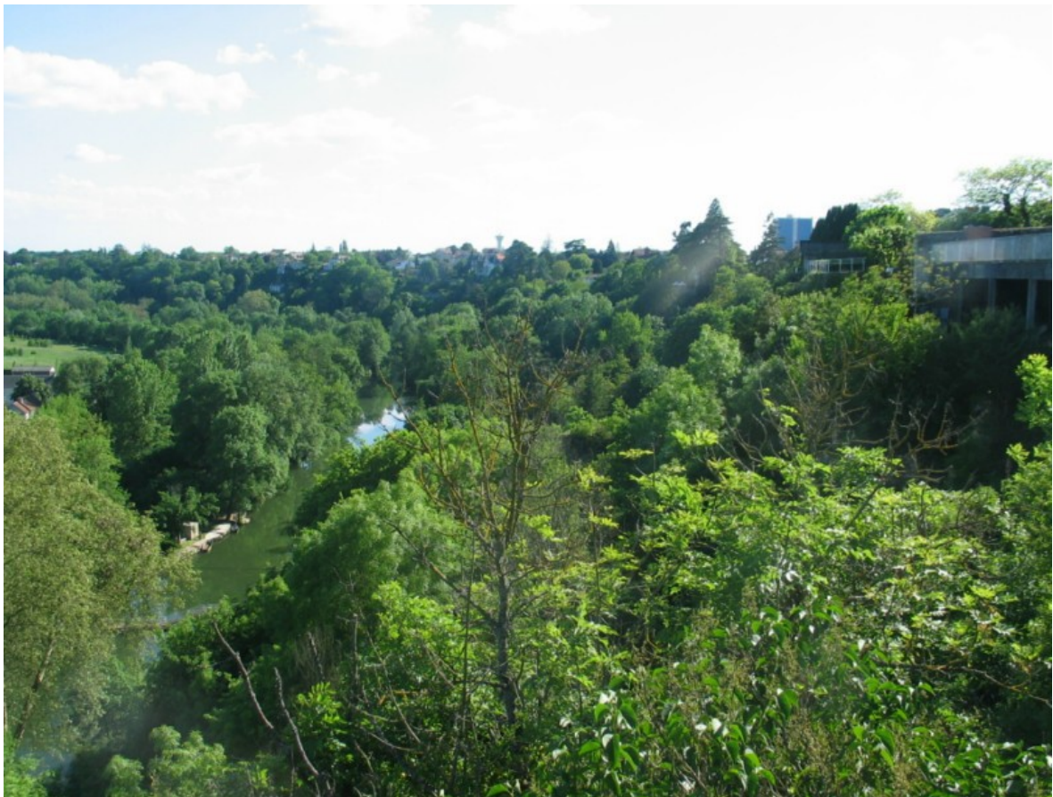
Photo 5 Vue vers le sud de la vallée du Clain en bordure de la rue de la Libération.