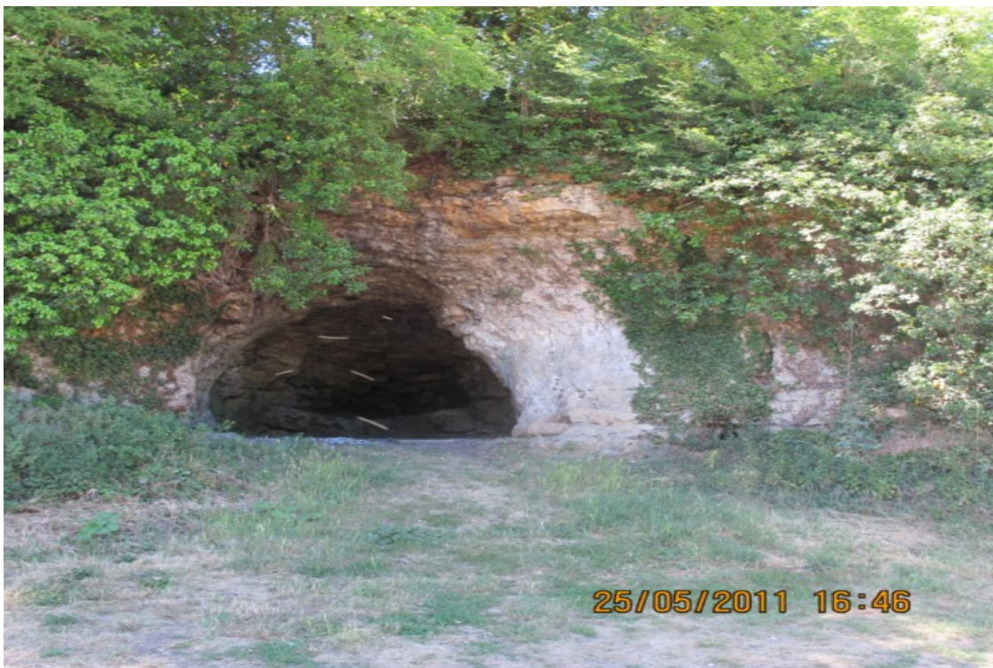
Photo 25 Vue sur l'entrée de la grotte à Calvin (site inscrit 2 juin 1932). La falaise à cet endroit n'a qu'une dizaine de mètres de hauteur. C'est un espace légendaire où Calvin se serait réfugié en passant par Poitiers ; actuellement lieu prisé pour les fêtes estudiantines.