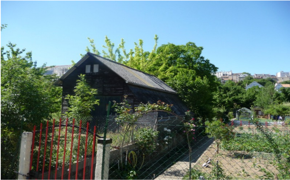
Photo 9 Vue sur les jardins ouvriers du Pré Roy en fond de vallée, rive gauche au niveau du début de la promenade des Cours. Au fond on aperçoit le centre-ville de Poitiers sur l'oppidum.