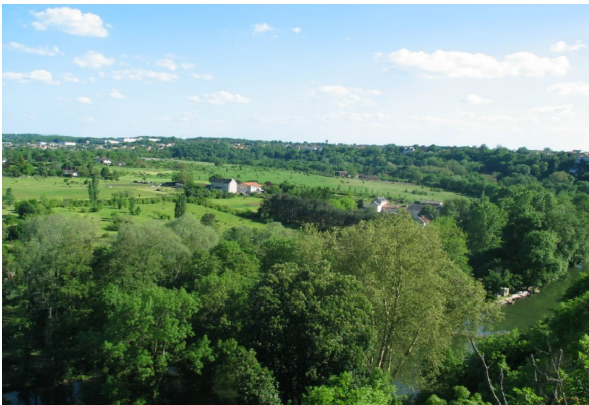
Photo 6 Vue nord-sud à partir de l'avenue de la Libération de la vallée du Clain vers l'amont et du grand méandre allant vers Saint Benoît : L'espace compris dans la partie convexe du méandre et formant un bombement a vocation à rester en milieu naturel.