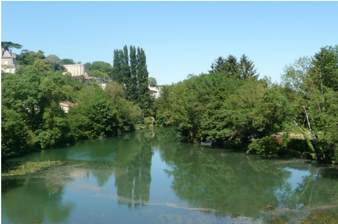
Photo 14 Vue du Clain prise vers le nord est du pont SNCF Paris Bordeaux, en direction du parc de Blossac, en partie masqué par la rangée de peupliers d'Italie.