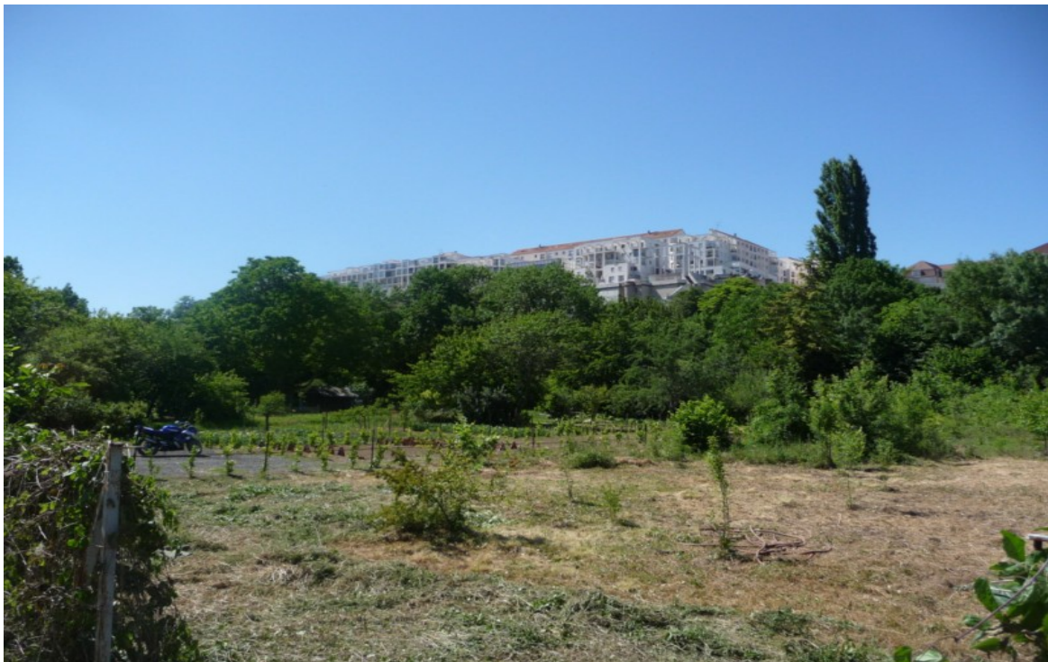
Photo 10 Vue sur les jardins ouvriers du Pré Roy et sur l'ensemble des constructions modernes de Rivaud à côté du parc de Blossac.