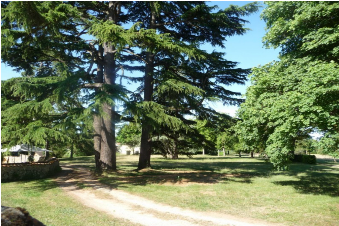
Photo 26 Deux vues sur le parc de la Mérigote où se trouve la petite villa toute simple de la famille de Jean Richard BLOCH. ( cf documentation en annexe du rapport de présentation ).