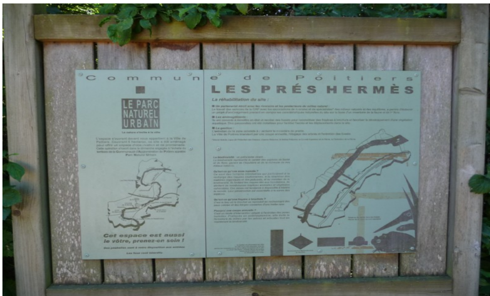
Photo 23 Panneau du parc naturel urbain de la ville de Poitiers expliquant toute la politique de la ville sur la gestion écologique des prairies humides inondables au lieu dit « les Prés Hermès ».