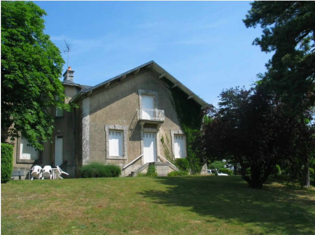
Photo 28 Vue sur la propriété de la Mérigote, maison de la famille de Jean Richard Bloch, autre espace à très forte connotation historique où se sont rassemblés les plus grandes notoriétés nationales des arts et de la littérature entre les deux guerres. Cette maison est située près de la falaise dominant le Clain de 35 mètres. On y découvre une vue panoramique superbe sur toute la vallée tant sur Poitiers que sur Saint-Benoît. Cette propriété de la Mérigote a été vendue par les héritiers BLOCH à la ville de Poitiers. (Cf documents en annexe).