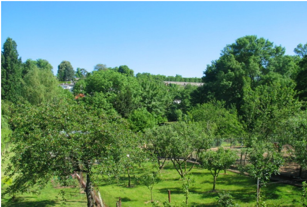
Photo 12 Vue à partir de la rue du Bas des Sables sur les jardins potagers, les vergers ou les jardins d'agrément en fond de vallée en rive droite, ici un peu en amont du parc de Blossac que l'on aperçoit au fond du cliché.