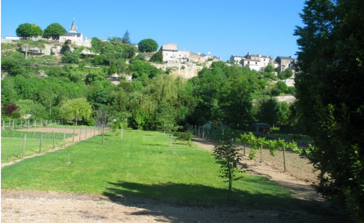
Photo 13 Vue à partir de la rue du Bas des Sables sur les jardins potagers en fond de vallée en rive droite, le Clain coule au bout de ces jardins, juste sous l'avenue de la Libération dont on voit le trait du bâti en sommet de coteau, exclu du classement.