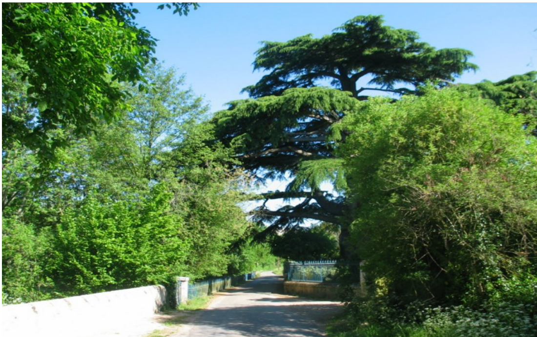
Photo 19 Vue sur le chemin du Bas des Sables en rive droite du Clain au niveau d'un vénérable cèdre, l'un des plus beaux de la région se trouvant dans la propriété de la photo 20 ci-dessous. Il a bien résisté à de nombreuses tornades locales et à la tempête du 27 décembre 1999.