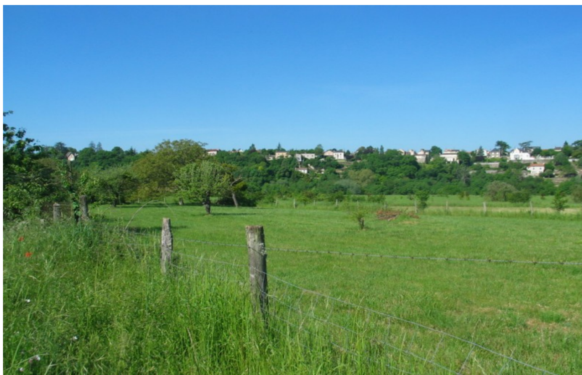
Photo 7 Vue à partir du haut du chemin du Sémaphore d'est en ouest vers la vallée du Clain en contre bas et surplombée par le bâti le long de l'avenue de la Libération.