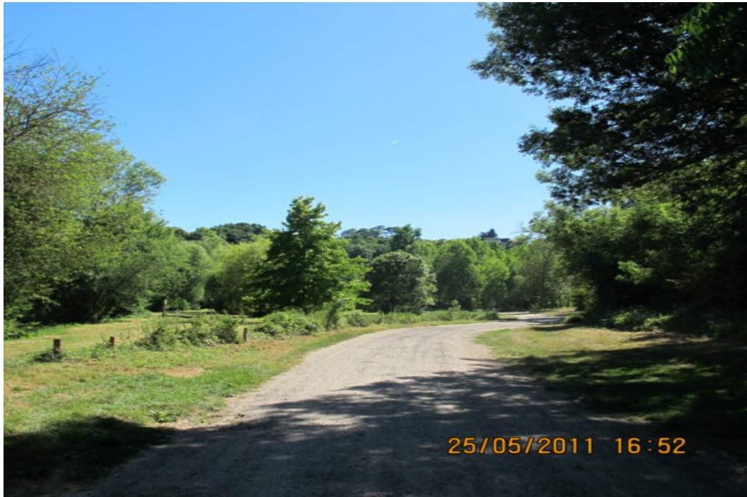
Photo 24 Vue sur le chemin de la Grotte à Calvin en rive droite longeant les prairies humides, c'est une ambiance totalement champêtre en pleine agglomération poitevine.