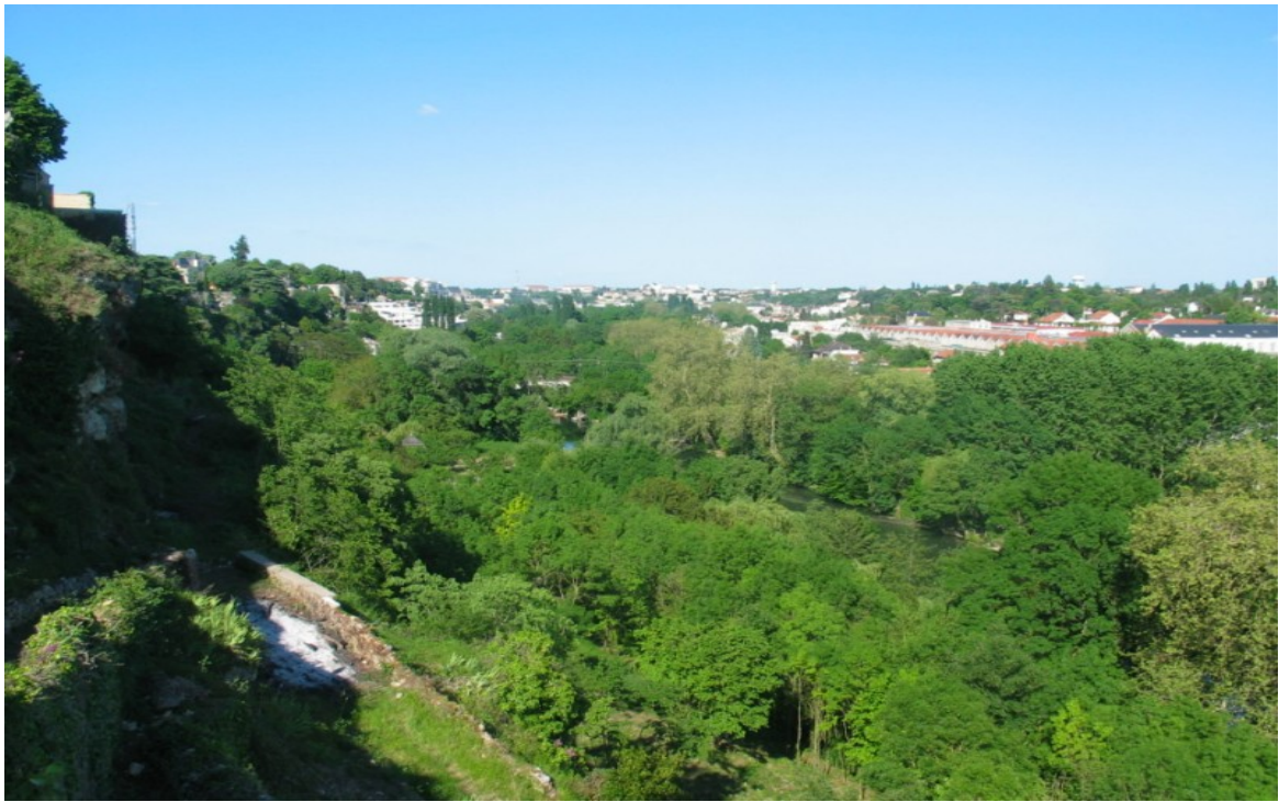
Photo 4 Vue vers le nord de la coulée verte de la vallée du Clain photo prise à partir des falaises dominant le Clain au niveau de l'institut des sourds avenue de la Libération.