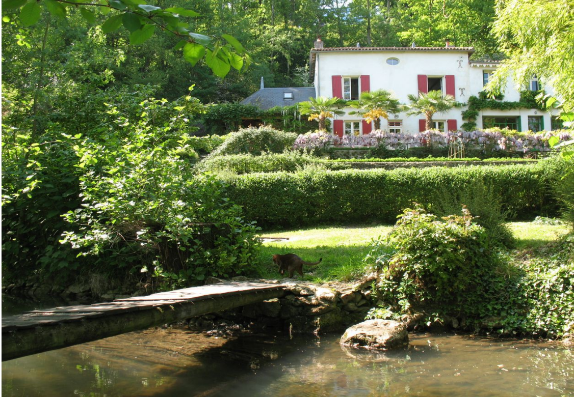
Photo 18 Vue sur l'ancienne guinguette des « Trois Îlots » superbement restaurée en rive gauche du Clain, sous les falaises bordant l'avenue de la Libération.