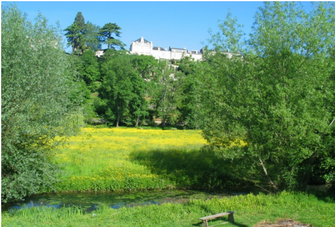
Photo 22 Vue à partir du Chemin de la Grotte à Calvin sur les prairies humides en rive droite du Clain. Une grande partie de ces prairies sont la propriété de la ville de Poitiers. Elles sont gérées de façon écologique dans le cadre du parc naturel urbain. Elles présentent une biodiversité grandissante avec une station de fritillaire pintade ( ritillaria meleagris ) la plus importante du Poitou-Charentes, plante inscrite sur la liste rouge de la région. Ces prairies sont parcourues par divers petits bras et canaux du Clain qui sont des lieux importants de frayères à brochet et de reproduction pour les amphibiens.