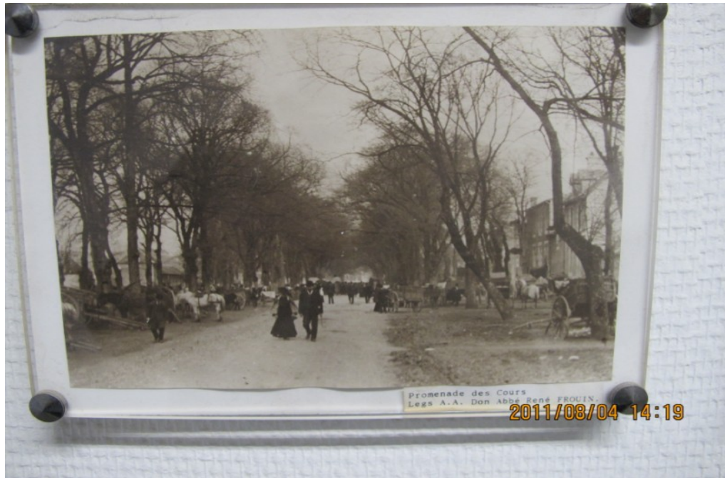
Photo 2 Promenade des Cours au début du XXème siècle : c'était le lieu privilégié des grandes foires de Poitiers. il était à l'époque planté que de tilleuls au premier plan et vraisemblablement d'ormes .