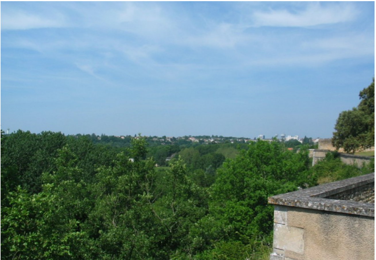
Photo 8 Vue plein ouest sur la vallée du Clain en direction de Poitiers à partir des terrasses du parc de la Mérigote surplombant de 35 mètres la vallée du Clain en rive droite, la rivière coule en bas de la falaise. A l'horizon, on voit la bande de bâti bordant l'avenue de la Libération. On a également une très belle vue vers le sud ouest sur la zone de la Varenne à Saint-Benoît en rive gauche, et vers le sud sur tout l'ensemble de la vallée à Saint-Benoît plongée dans la végétation luxuriante.