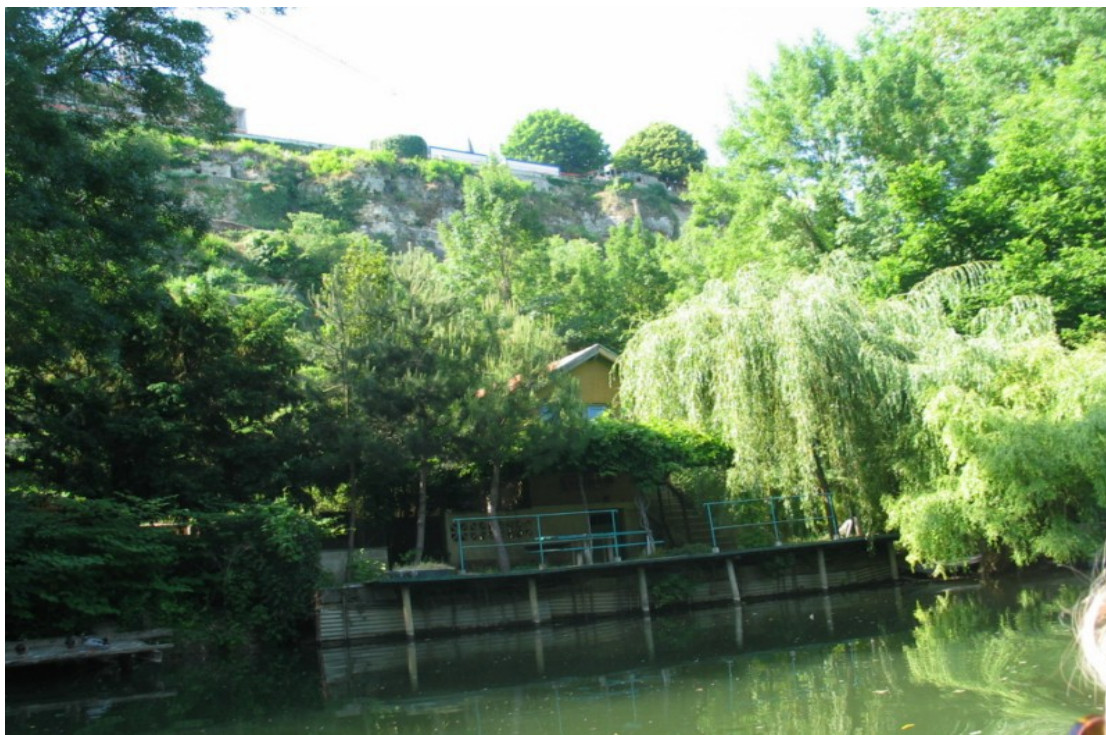
Photo 16 Vue sur une ancienne guinguette « Le Fleuve Léthé » en rive gauche sous l'avenue de la Libération. ( cf en annexe du rapport de présentation)