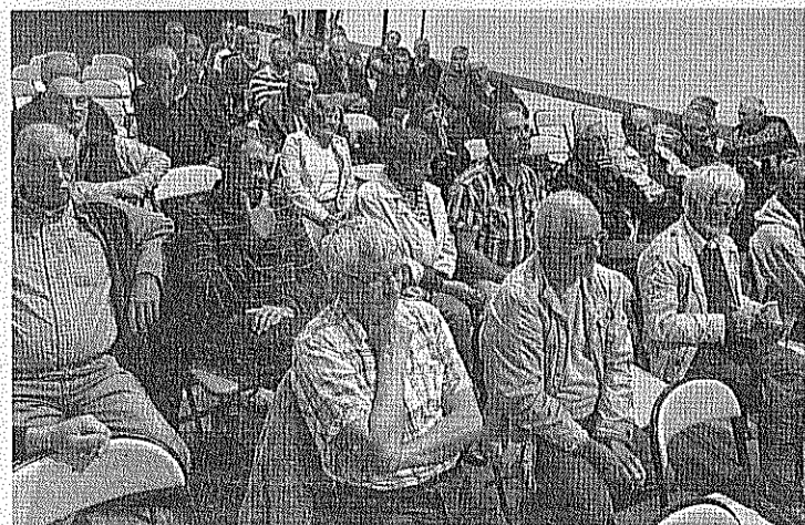
Une centaine de personnes, surtout des propriétaires fonciers et des élus, étaient présents.