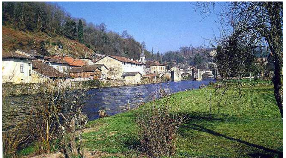
Les vieux quartiers avec le pont médiéval et la chapelle

Il serait souhaitable de déplacer le dépôt de boisson aux couleurs particulièrement voyantes, situé dans la vallée.