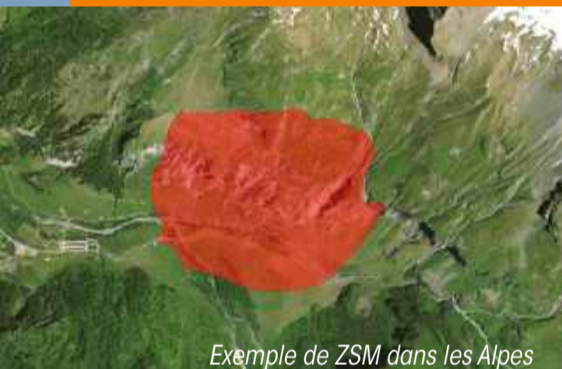
Exemple de ZSM dans les Alpes

C'est un espace d'environ 3 km de large au sein duquel les activités sont susceptibles de porter atteinte aux gypaètes sur leur site de reproduction.