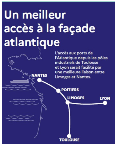
carte de France