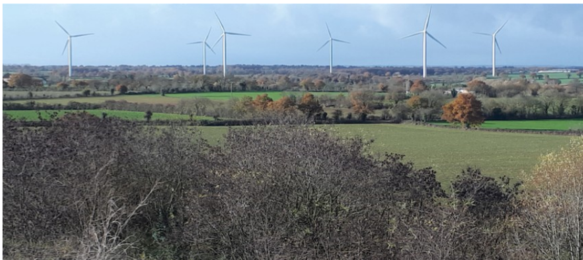
Vue sur les paysages environnants depuis le sommet d'une ancienne verse