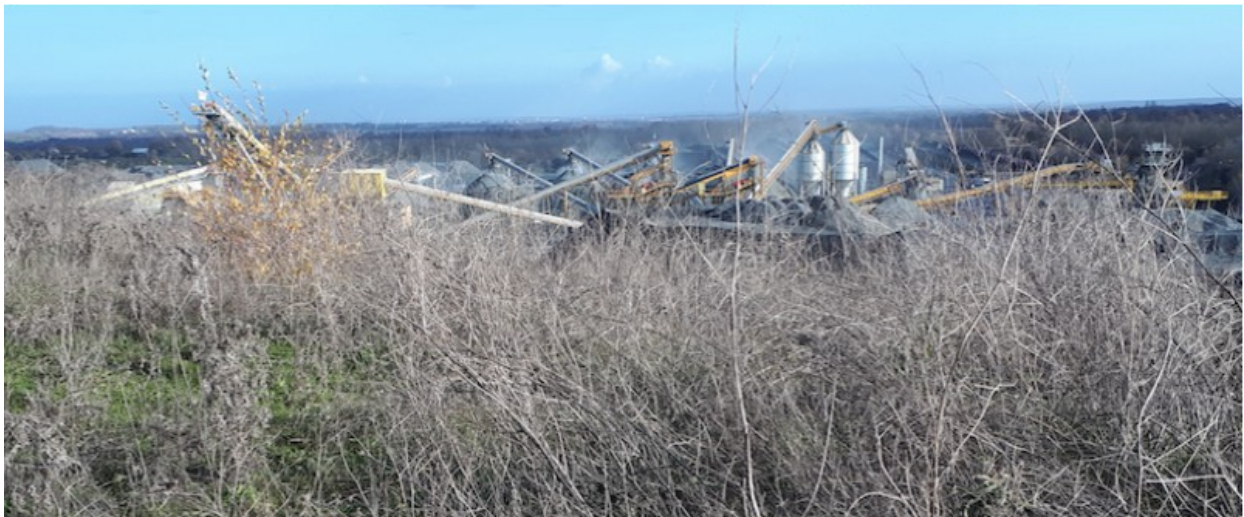
Vue depuis le site (depuis le haut de la verse) sur des installations de traitement des matériaux.