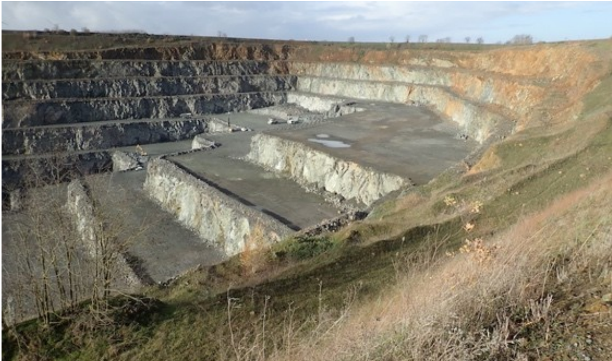
Valoriser les « métiers de carrières » et les sites spectaculaires créés depuis le belvédère

Une réflexion semble opportune à engager dans ce sens en partenariat avec les collectivités territoriales, les offices de tourisme et autres partenaires du développement pour une vocation finale plus ambitieuse. Ce type de réflexion peut s'avérer d'autant plus riche, si elle s'inscrit dans l'optique d'une mise en réseau de plusieurs sites de carrière sur un même territoire.