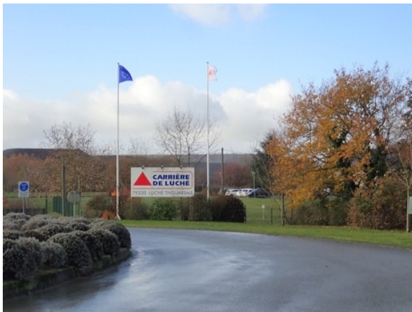
Vue depuis l'accès au site et bâtiment d'accueil