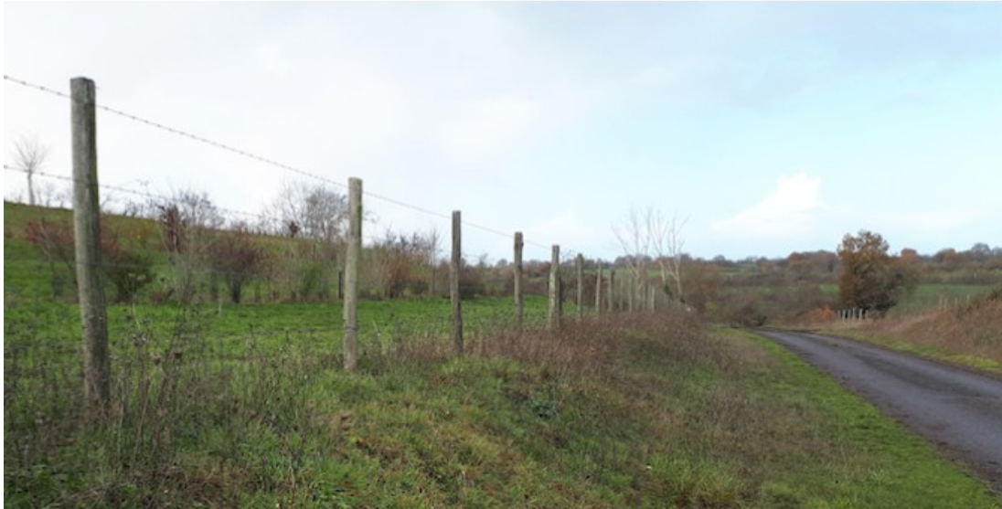
Vue depuis la route longeant le site d'exploitation