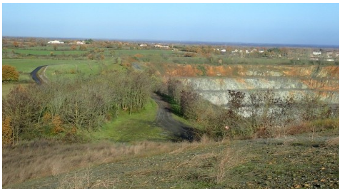
Vues depuis le sommet de la verse