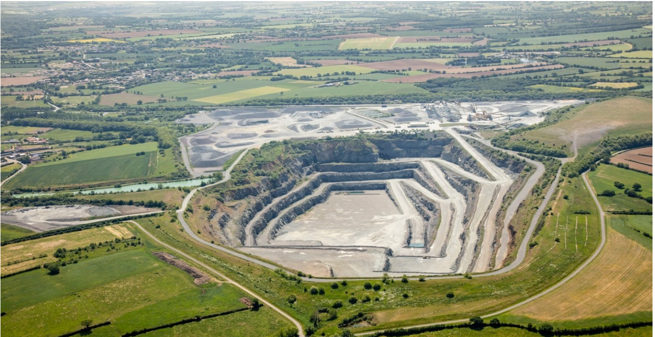
Photo aérienne oblique mai 2018

La réduction de l'impact visuel de la carrière s'appuie principalement sur l'insertion des vers (collines artificielles d'une hauteur de l'ordre de 35 m) et sur le traitement des transitions entre la carrière et les paysages extérieurs (habitats mitoyens ; réseaux hydrographiques ; parcellaires bocagers ; etc.)