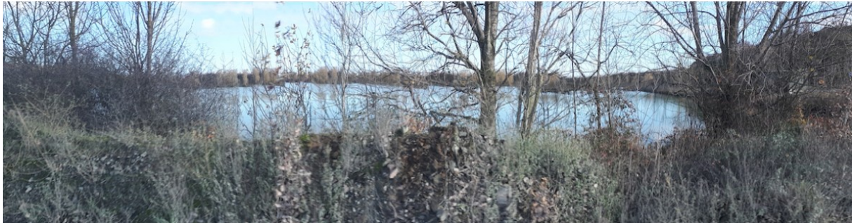
Vue sur un bassin de décantation existant