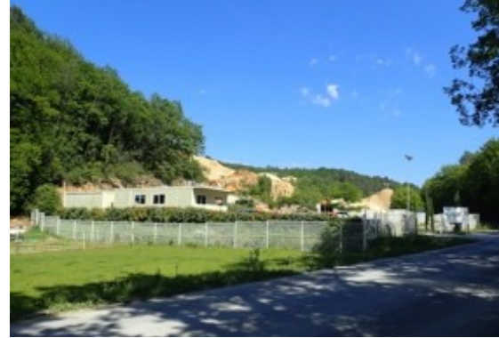
Les installations, masquées depuis la RD avant de franchir la rivière, sont toutefois visibles aux abords immédiats