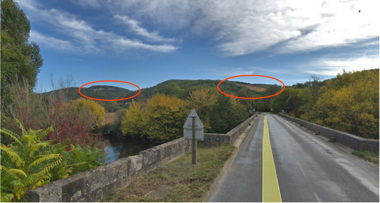
Co-visibilité des falaises calcaires (à gauche) et du front de taille de la carrière (à droite)

La possibilité de fondre la carrière dans le paysage en se rapprochant de l'aspect des falaises calcaires est une piste réaliste qui permettrait de s'inscrire dans les motifs de paysage caractéristique de la vallée.