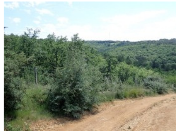
Une clôture discrète très peu visible