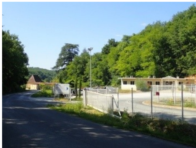
Co-visibilité des bureaux avec une habitation de caractère