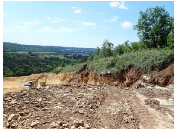
Conserver une frange végétale au sommet du front de taille