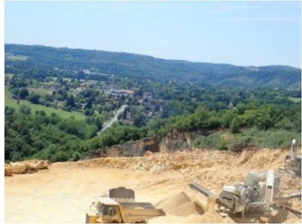
Vue sur la carrière depuis la RD et vue de la RD depuis la carrière

→ S'appuyer sur la recolonisation végétale et la patine de la roche