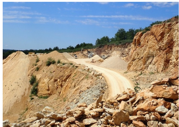
Utiliser les dépôts de stériles afin de cicatriser le modelé du coteau