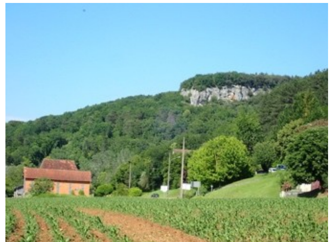
Falaises caractéristiques de la vallée situées à proximité