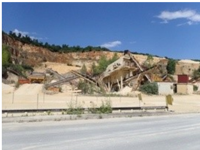
Vue frontale depuis la route d'accès

Vue depuis les riverains : La commune la plus proche ainsi que son château n'a pas de vis-à-vis avec la carrière. C'est depuis la commune située de l'autre côté de la rivière que la carrière est très visible. L'entrée de la carrière, récemment réaménagée sur le RD, a perdu l'écran végétal qui la dissimulait.