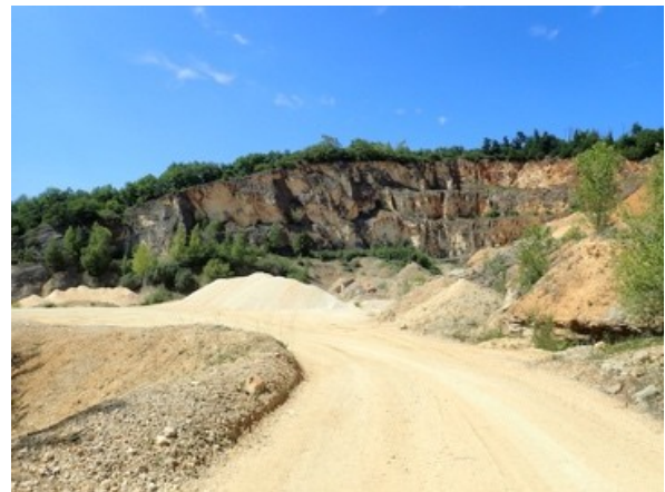
Les secteurs exploités en premier se végétalisent et se patinent