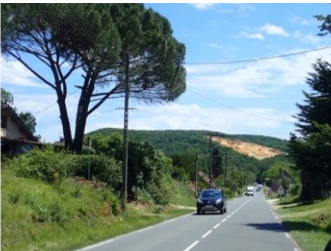
Vue depuis la RD

Vues depuis l'extérieur : La carrière située sur le versant boisé en contre-haut du lit de la rivière et dans l'axe de la RD sur plus d'1 km constitue un point focal majeur par son effet de contraste et caractérise le paysage. La partie basse de l'exploitation dissimulée par une combinaison de topographie et de végétation n'est pas perçue, d'autant plus que la roche anciennement exploitée devient grise. Le front de taille sommital en cours d'exploitation, localisation de l'extension qui passe de 60 à 90 m, est actuellement très visible. Un ourlet végétal assure une transition entre la roche et le ciel.