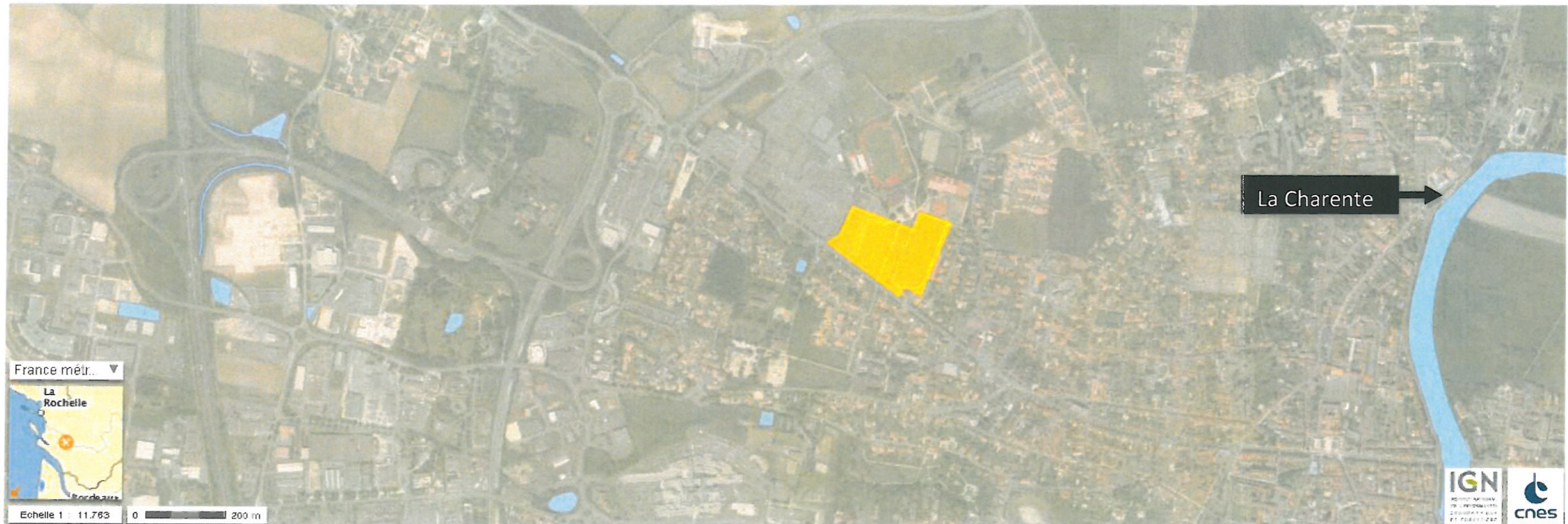
Figure 6 : Plan du réseau hydrographique autour du site