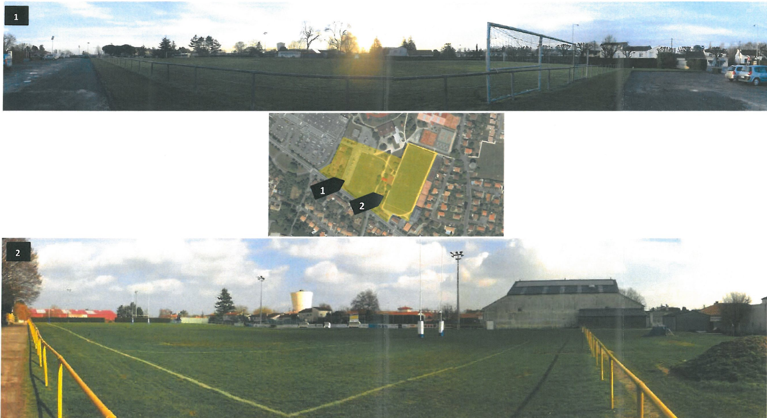
Figure 2 : Photographies de l'environnement proche du site (2012)