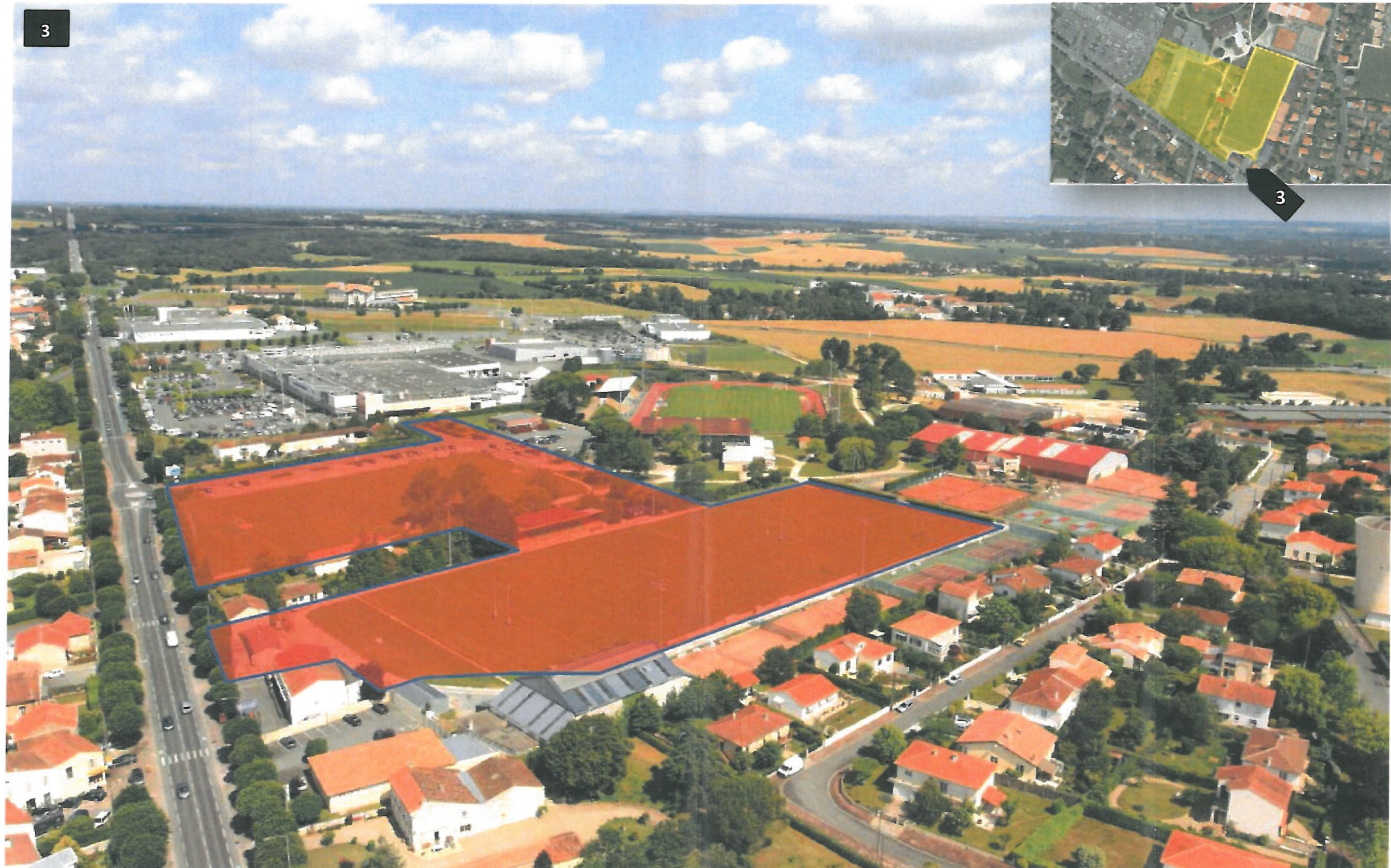
Figure 3 : Photographie de l'environnement lointain du site (2012)