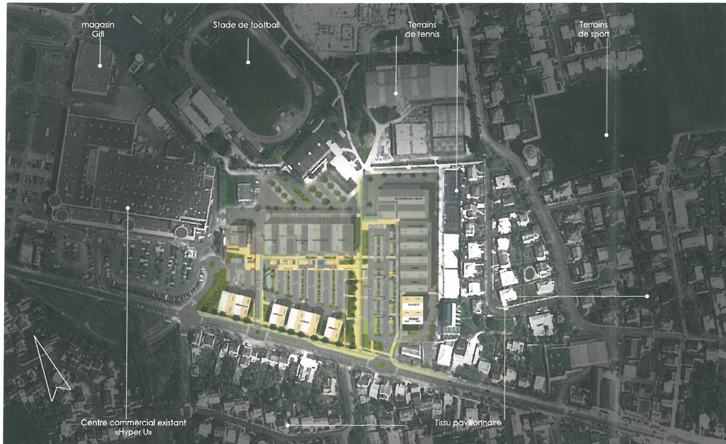
Figure 5 : Le projet dans son environnement