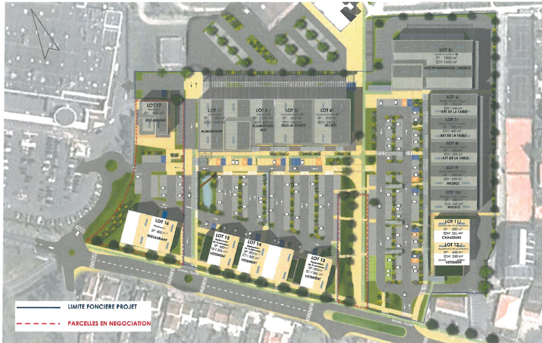
Figure 4 : Plan descriptif du projet