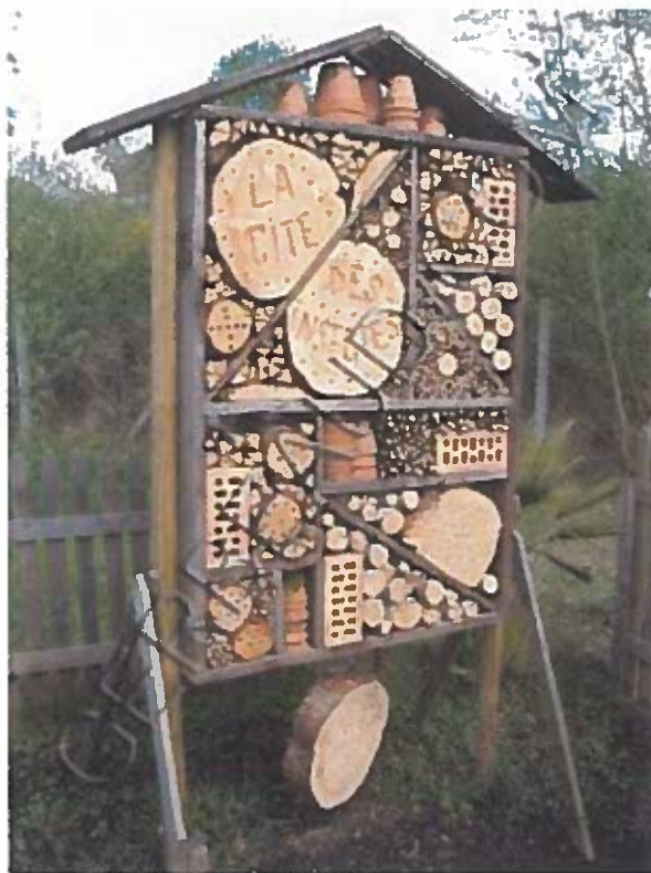
Exemple d'hôtel à insectes

Dans l'optique de favoriser le maintien de la biodiversité sur le site et de contribuer à la préservation de la ressource alimentaire de l'espèce, l'hirondelle étant insectivore, un hôtel à insectes (dimensionné sur les conseils de la LPO) sera installé dans les espaces verts jouxtant le bâtiment de la mairie.