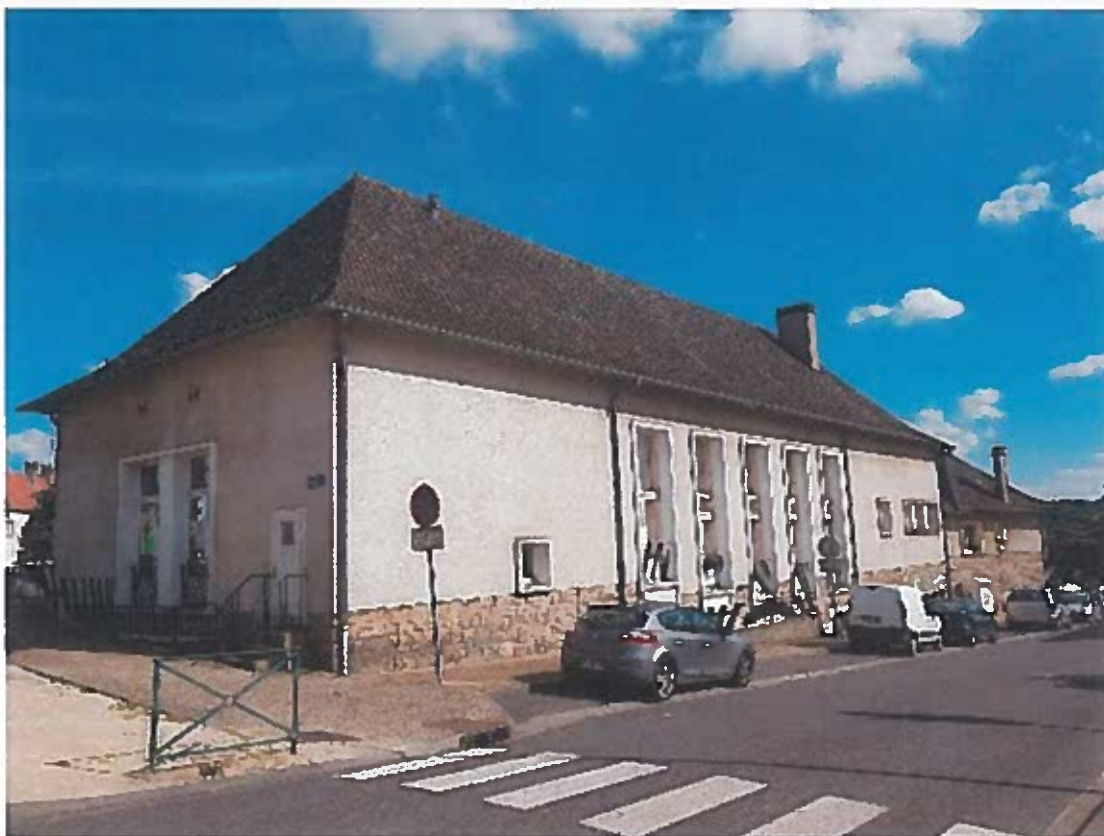
FAÇADE CINÉMA COTÉ RUE