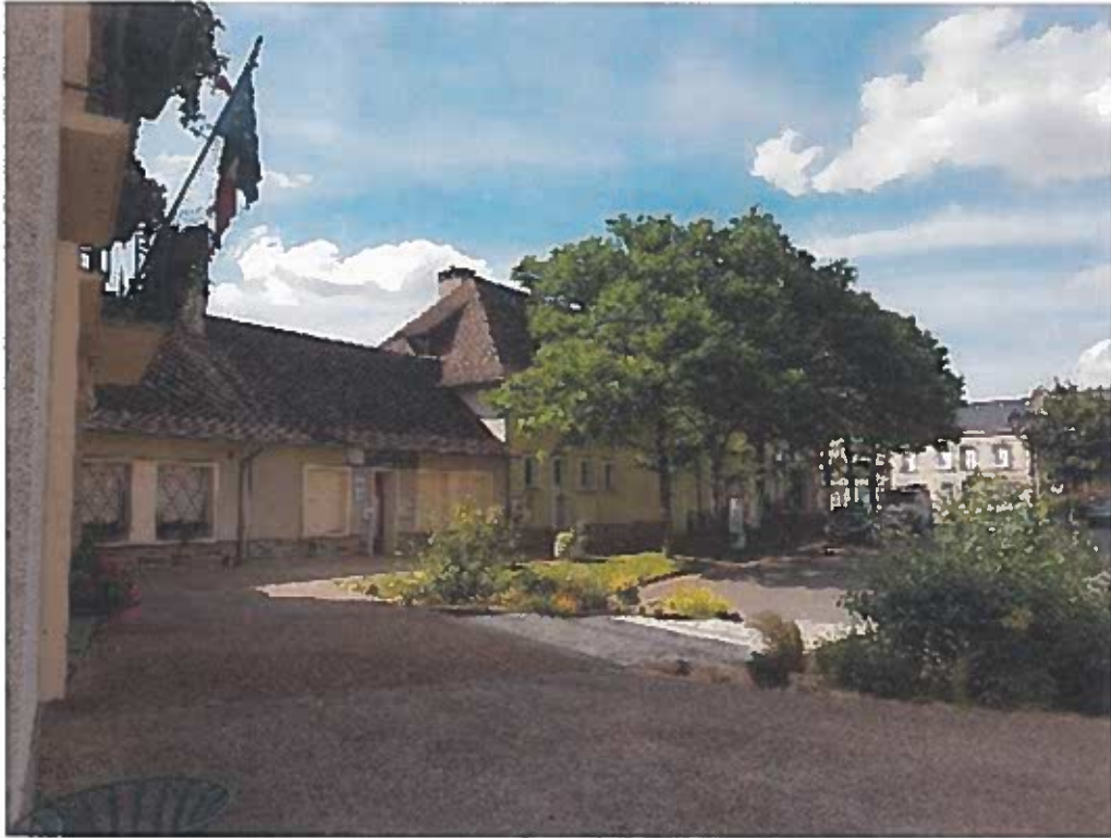
FAÇADE PRINCIPALE OFFICE DU TOURISME ET CINÉMA