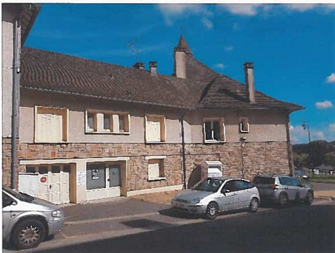
FAÇADE OFFICE DU TOURISME COTE RUE