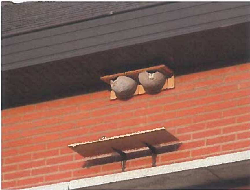
Exemple de nids artificiel (illustration fournie par la LPO Limousin)

Afin de limiter l'impact des salissures sur les façades rénovées, des planchettes sous les nids, à une distance ne gênant pas l'accès pour les oiseaux. Ces planchettes seront positionnées à 1 cm du mur, afin de ne pas créer un nouvel emplacement propice à l'installation de nouveaux nids en dessous.