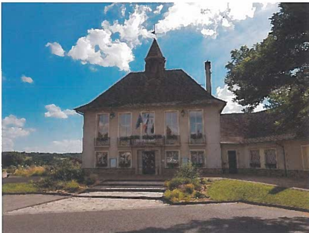
FAÇADE PRINCIPALE MAIRIE

Ce bâtiment a beaucoup évolué au fil des années. Datant des années 60, il est aujourd'hui nécessaire de lui redonner son cachet d'origine.