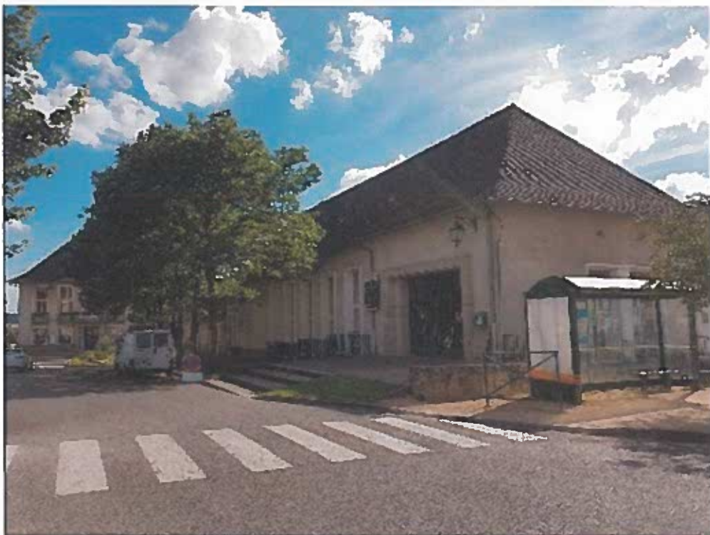
FAÇADE PRINCIPALE CINÉMA