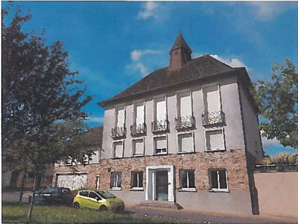
FAÇADE MAIRIE COTÉ RUE