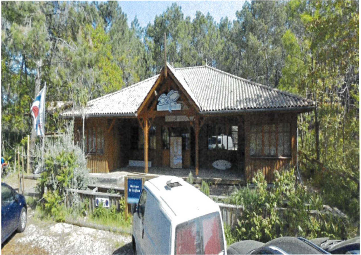
Photo de l'Etat initial