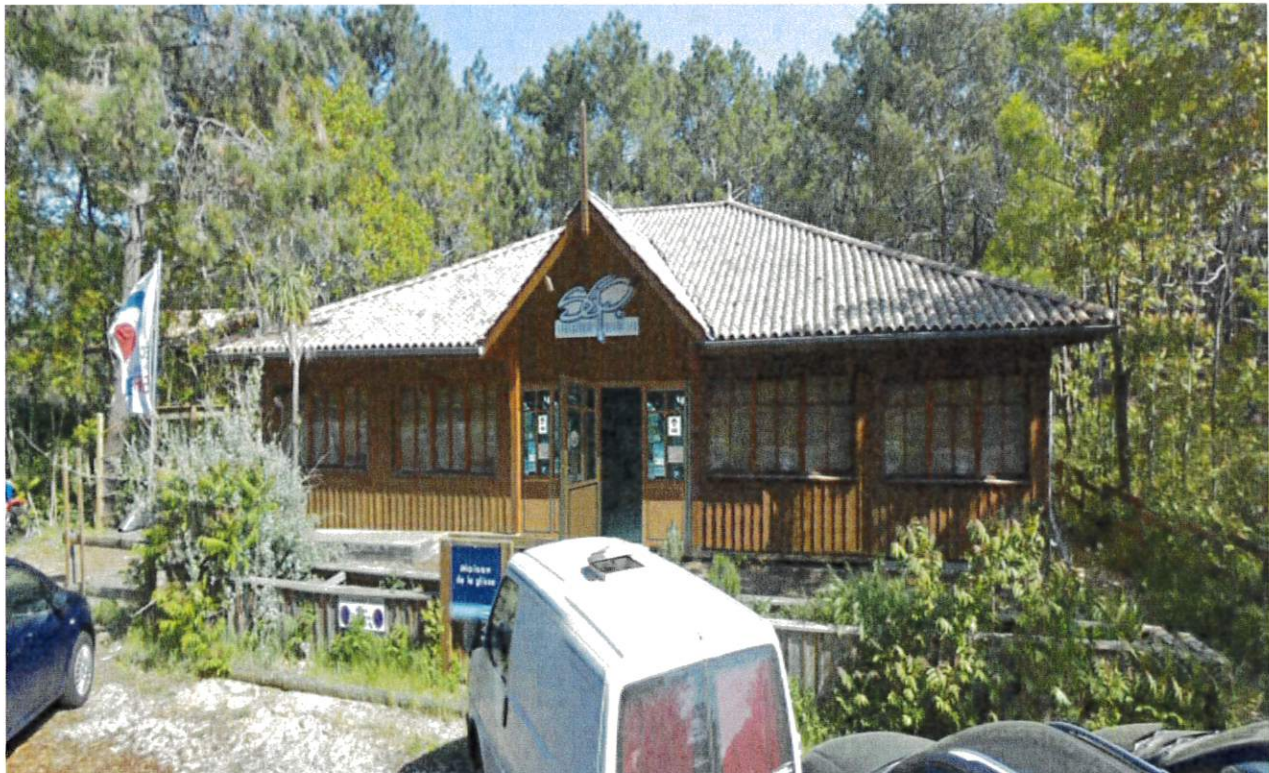
Insertion du projet