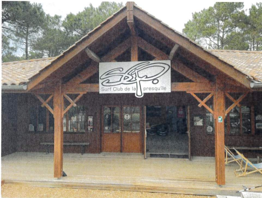
Façade concernée par les nids

Le porche couvert existant concerné par le projet abrite actuellement 3 nids :