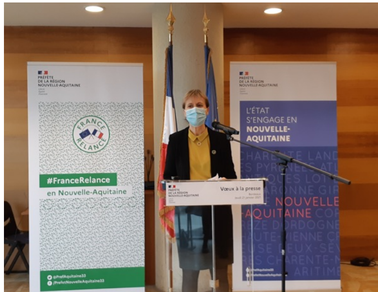
La préfète de la Nouvelle-Aquitaine et de la Gironde, Fabienne Buccio, lors des vœux à la presse

La liste des projets et plus d'informations, chaque mois, sur https://www.gironde.gouv.fr/Actualites/France-Relance-en-Gironde .