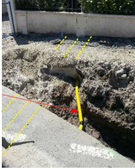
Branchement non trouvé dans le fuseau d'incertitude