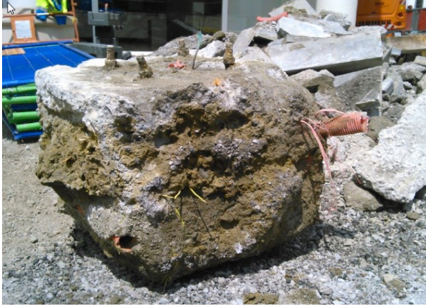
Réseau pris dans le béton