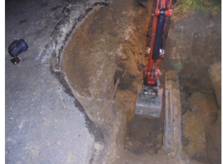
Réseau non trouvé dans le cadre des fouilles de préparation pour l'utilisation d'une fusée.