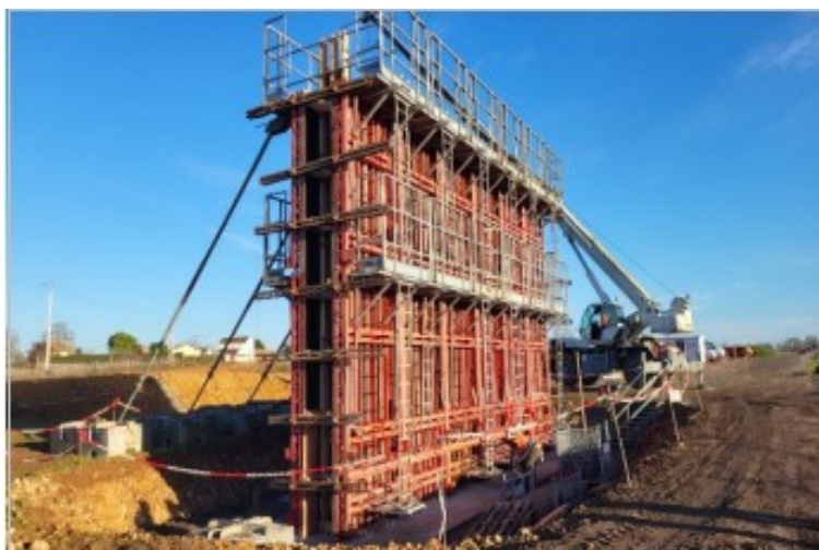
Réalisation du PS de la Failloderie

La réalisation des deux giratoires est également en cours au niveau des RD 11 et RD 13 depuis le 27 octobre et ce jusqu'à fin avril 2026.