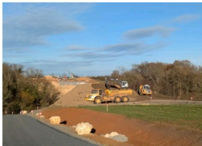
Réalisation du viaduc des Ages.