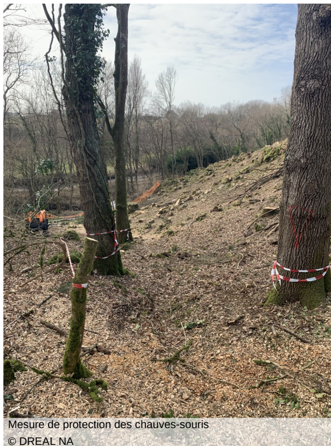
Mesure de protection des chauves-souris

Cette mesure a été mise en œuvre lors des travaux de déboisement de la vallée, avec la mise en place d'une clôture de chantier à 5 m du bord du ruisseau permettant de préserver le ruisseau et sa ripisylve.