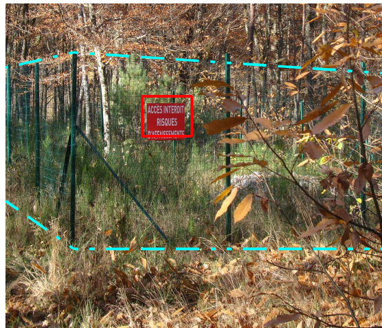
Périmètre et panneaux de sécurité

Cette inspection n'appelle pas de suite à l'égard de l'exploitant.