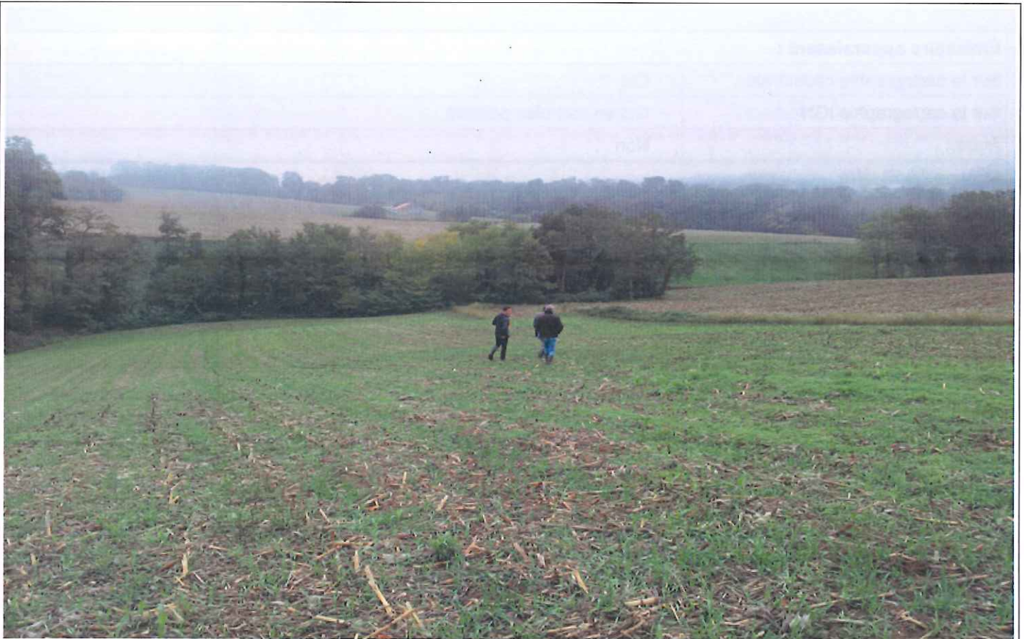
Vue générale de la vallée