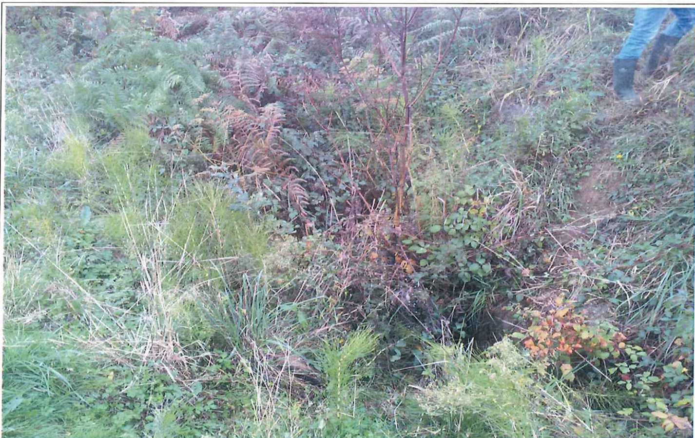
Vue générale de l'émissaire