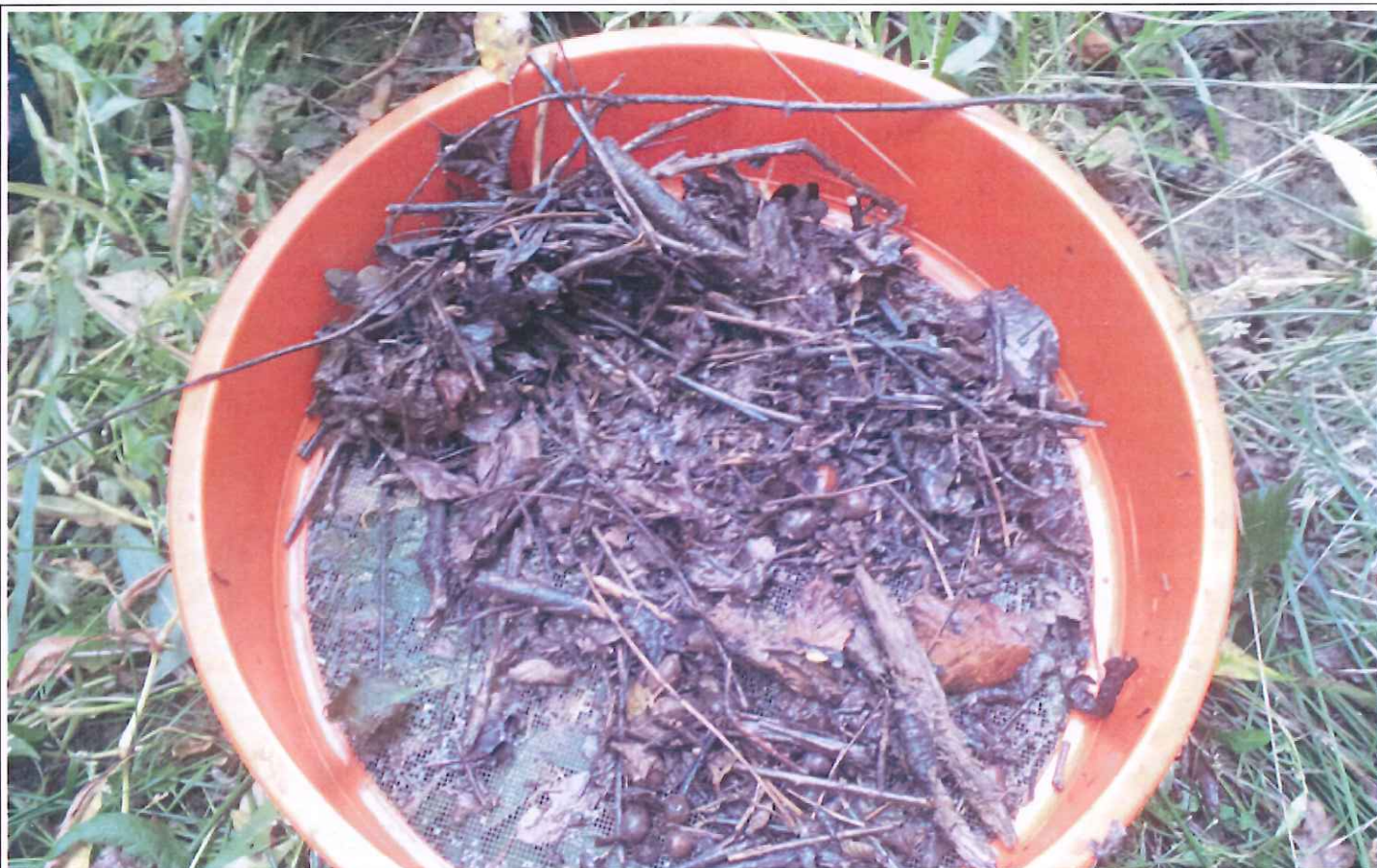
Litière extraite de l'émissaire : absence de gamare