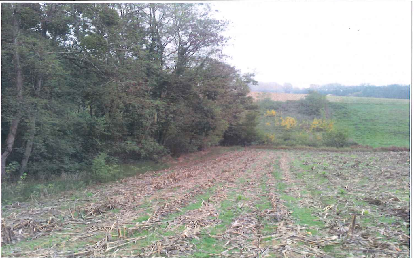
Vue du site d'implantation du barrage projeté