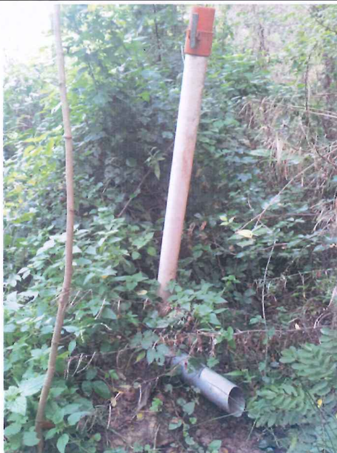
Pour info, présence d'un drain sur la parcelle agricole situé en rive droite