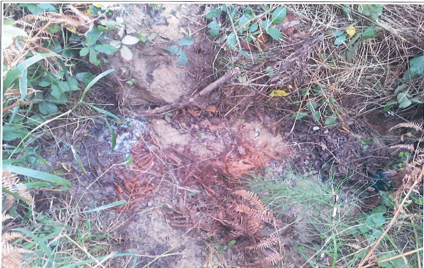
Émissaire au niveau du barrage : écoulement quasi nul et sédiments sans granulométrie différenciée