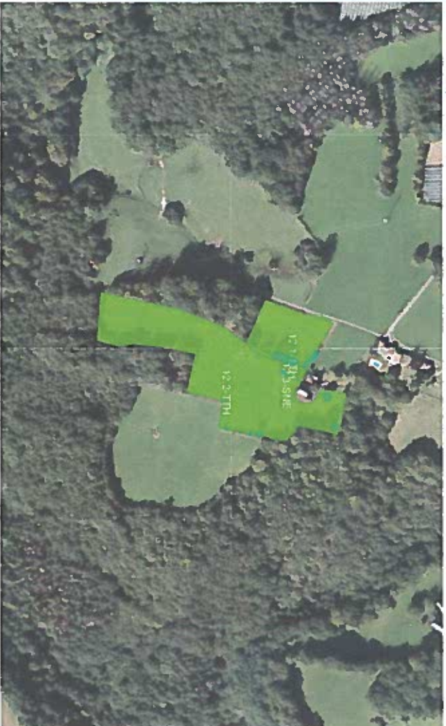
Echelle 1 / 3500 N° IRI 12 - Code INSEE : 19024 - Surface graphique (ha) : 2,23 - Périmètre (m) : 933,96 Coordonnées X: 917690 Y: 6474327

Photo Carte Couleur Noir & Blanc Calque Contour