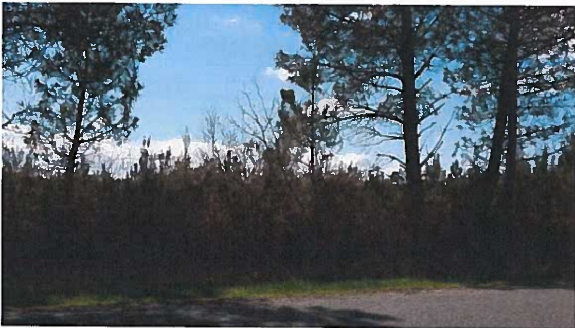
Photographie 2 (Bordure du chemin départemental 211)