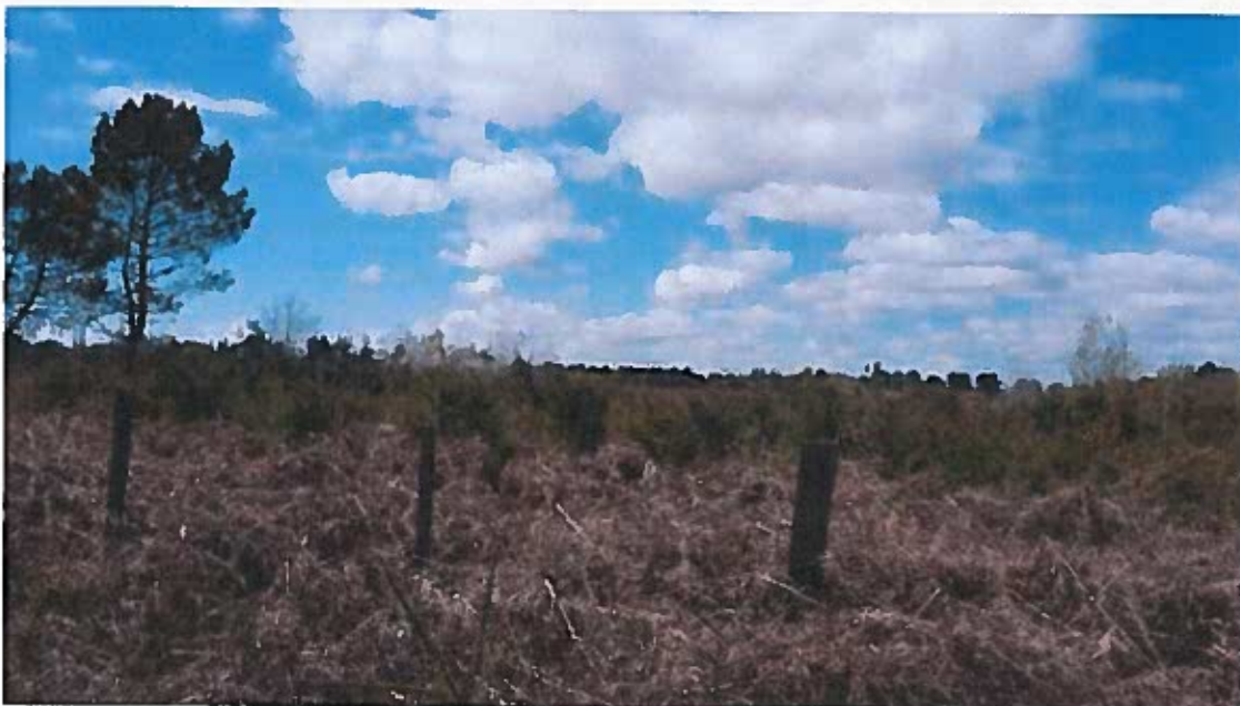
Photographie 3 (depuis la passe à l'est du site)