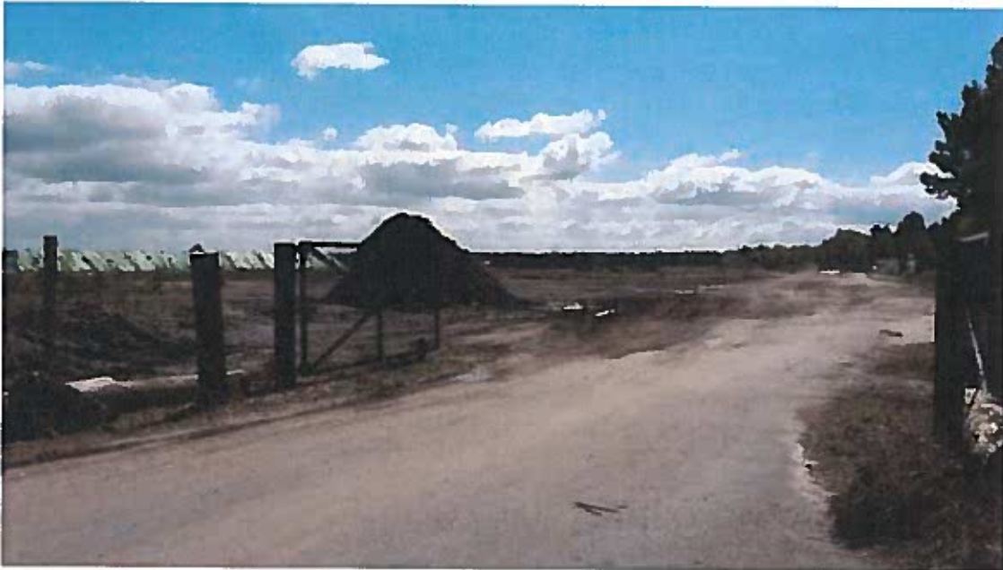
Photographie 1 (entrée du site)