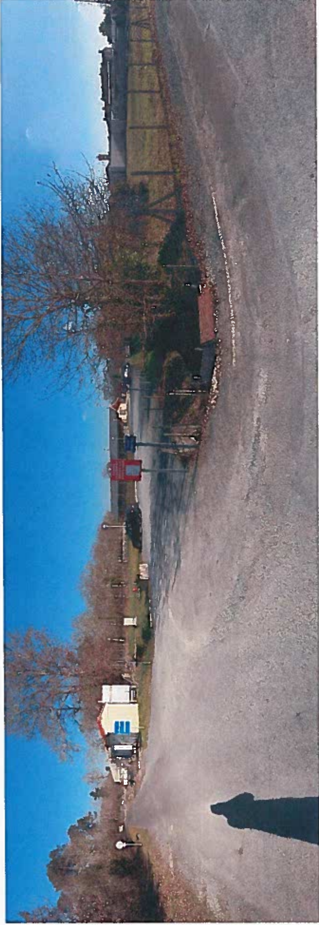
Prise de vue depuis l'intersection de la rue du Courreau et la route de l'Abbé Pierre