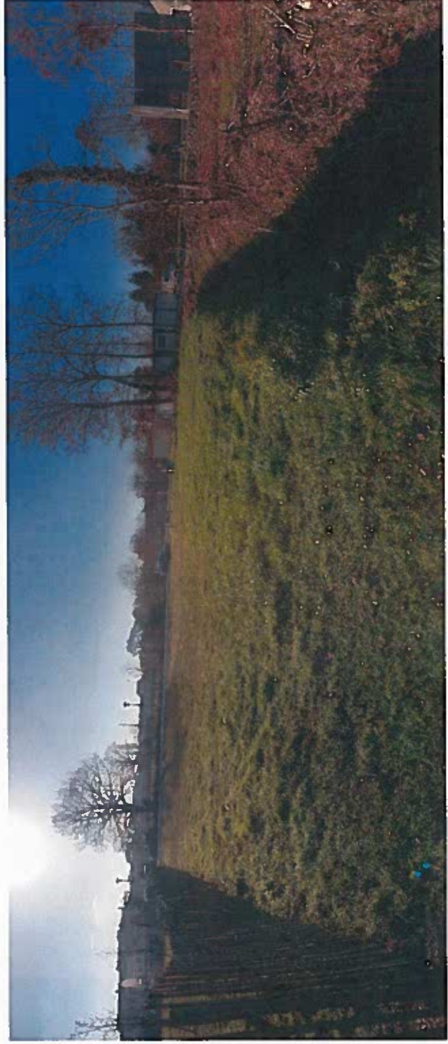
Prise de vue depuis l'intersection de la palissade et du fossé situés au nord du restaurant scolaire