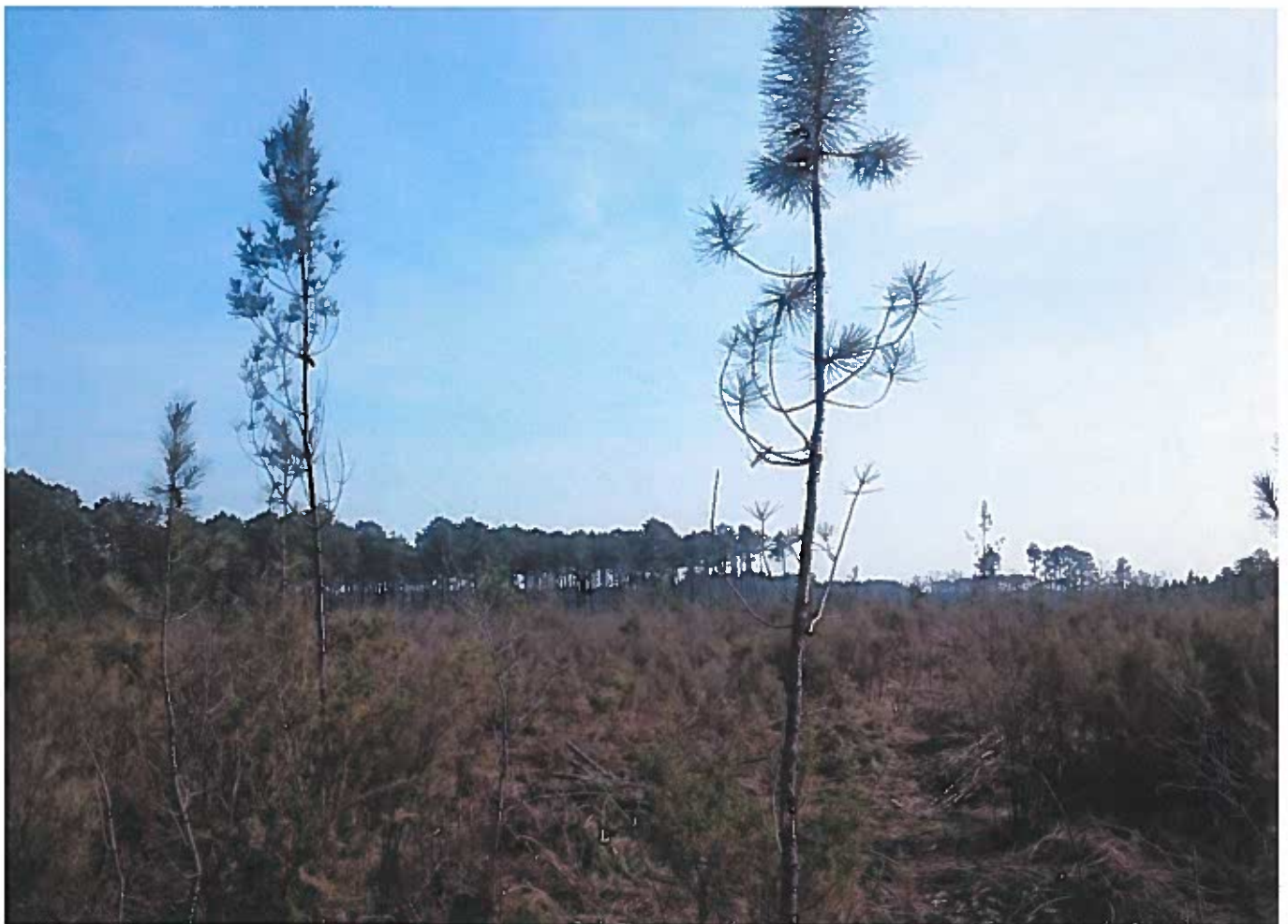
②③ Vue vers le Sud-Est.