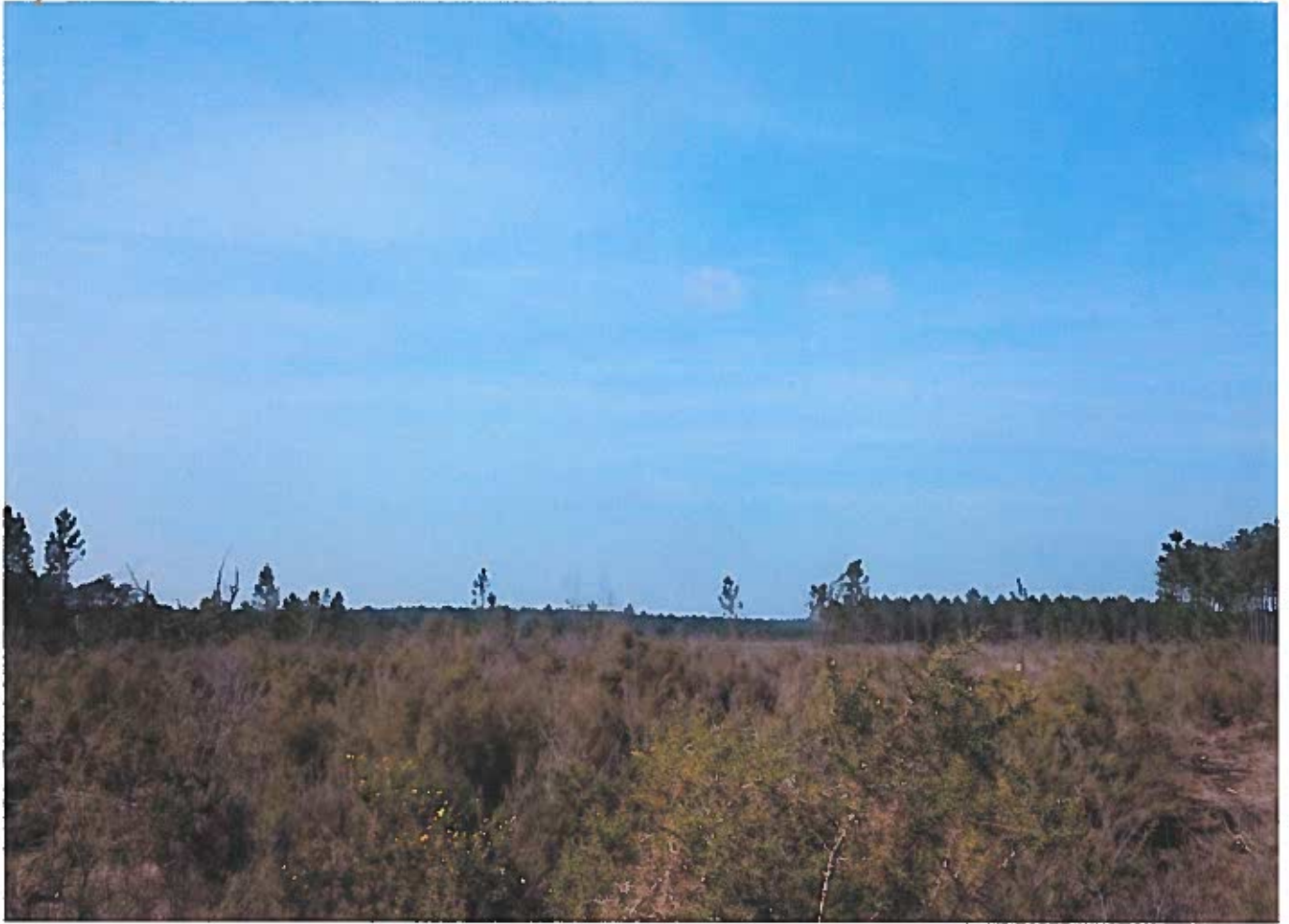
②③ Vue vers le Nord-Ouest.