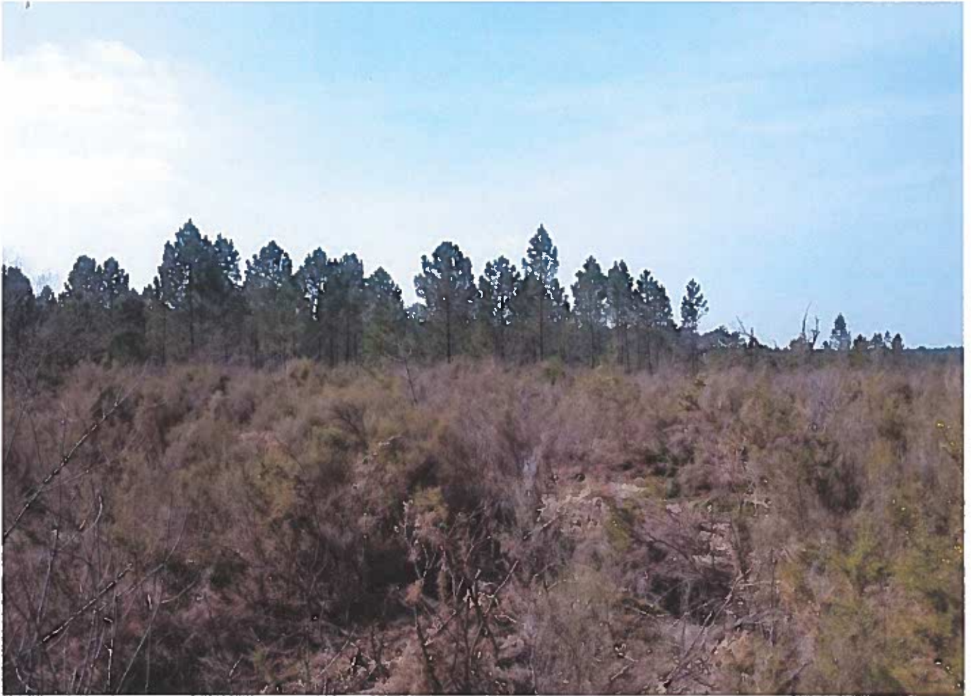
②.3 Vue vers l'Ouest