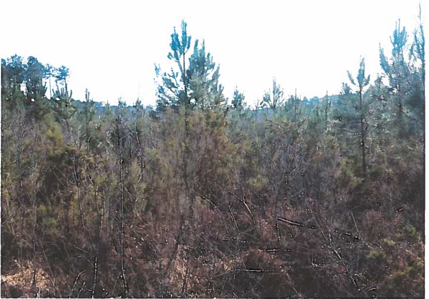
②.2 Vue de la zone non exploitée (Sud-Est)