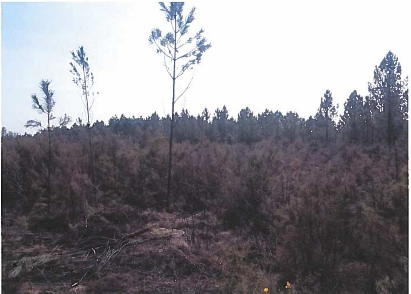
②.3 Vue vers le Sud.