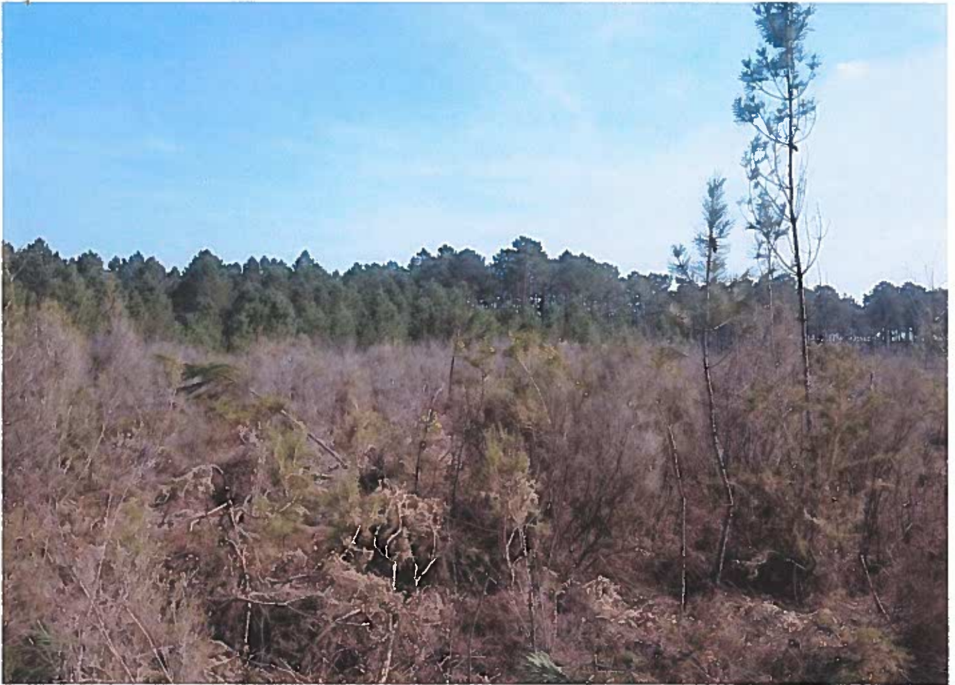
②.3 Vue vers l'Est