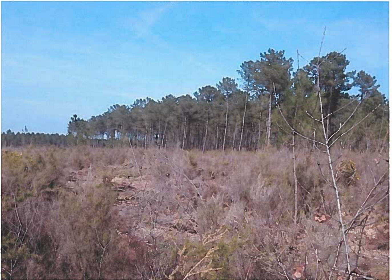
②.3 Vue vers le Nord.