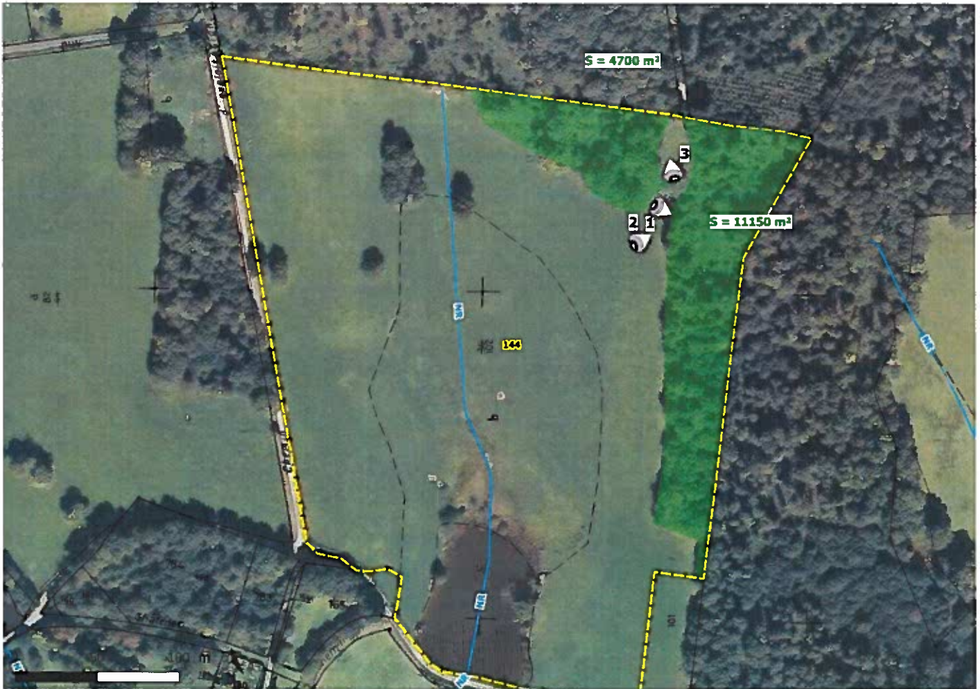
Localisation et orientation des prises de vue des photographies en date du 23/05/2017