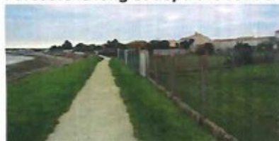
15 - sentier littoral (dans sa section Ouest au nord du quartier La Serpent)