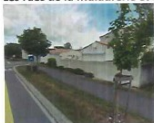
6 Carrefour route de St-Martin / rue de la Maladrerie