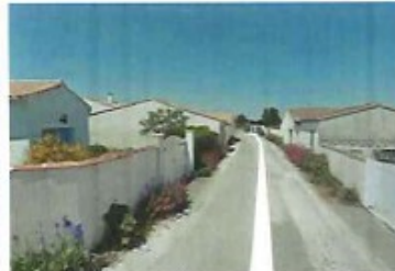
9 rue de la Serpent (axe Est Ouest)