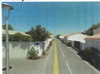
7 rue de la Maladrerie (axe nord sud)