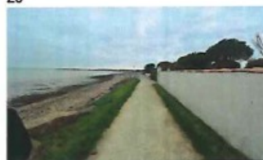
24 - vue sur l'impasse à l'Est (accès impasse depuis le centre-ville)