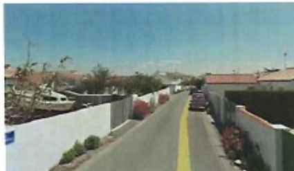
8 rue de la Serpent (axe Est Ouest)