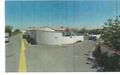
10 vue sur le carrefour de la rue de la Maladrerie avec le chemin de la Serpent