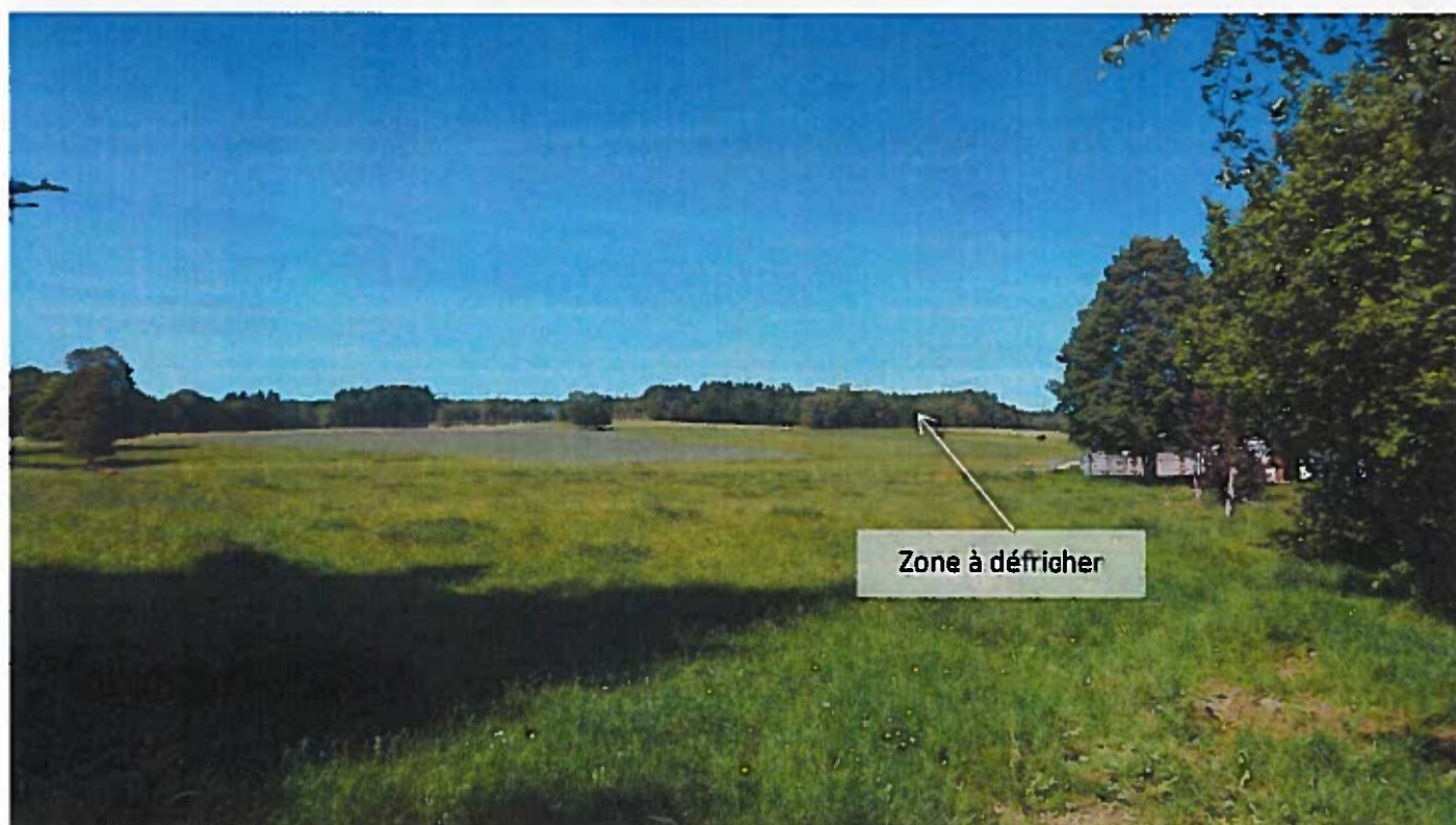
Photo 1 : Parcelles A 1050 et A 1051 vues depuis le siège de l'exploitation