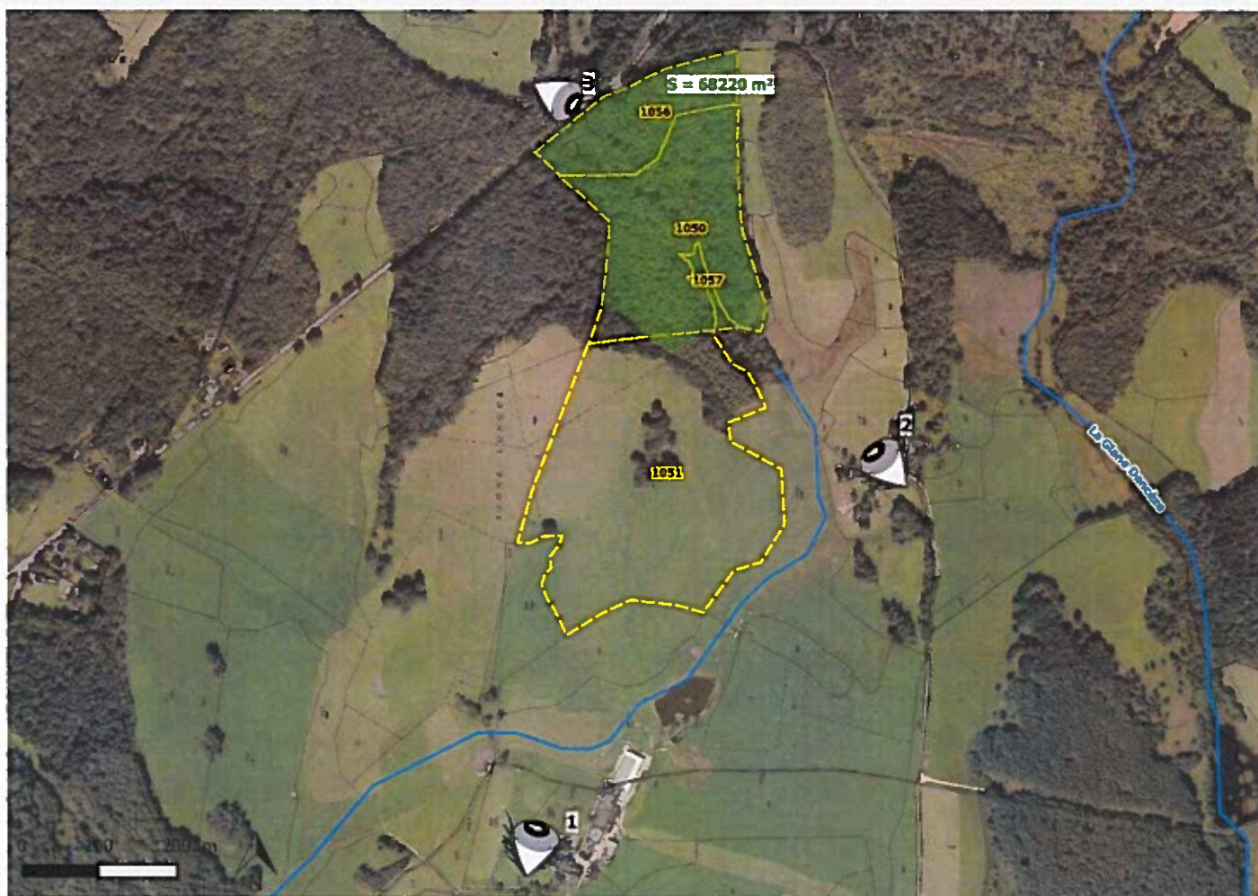
Localisation et orientation des prises de vue des photographies en date du 24/05/2017