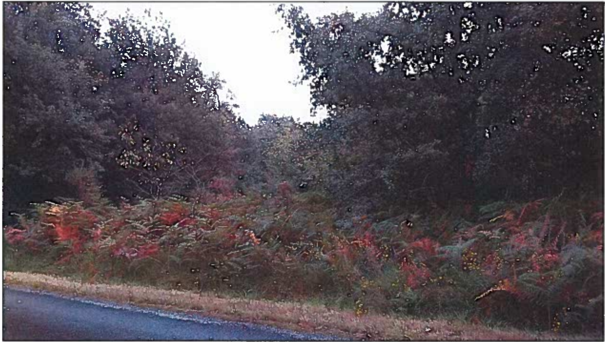
Photo n°2 prise le 04/09/2017 (localisation cartographique : Cf. annexe n°4)

Photo n°1 prise le 04/09/2017 (localisation cartographique : Cf. annexe n°4)