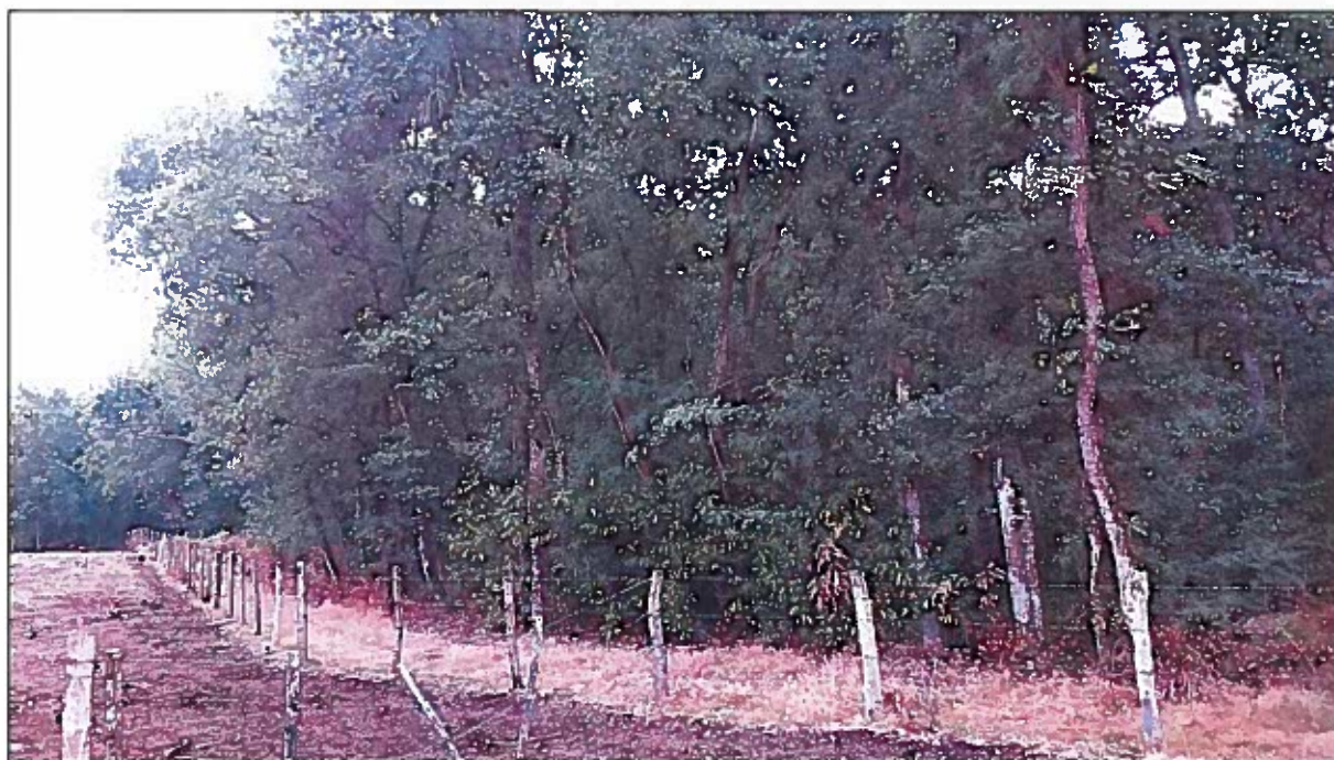
Photo n°3 prise le 04/09/2017 (localisation cartographique : Cf. annexe n°4)