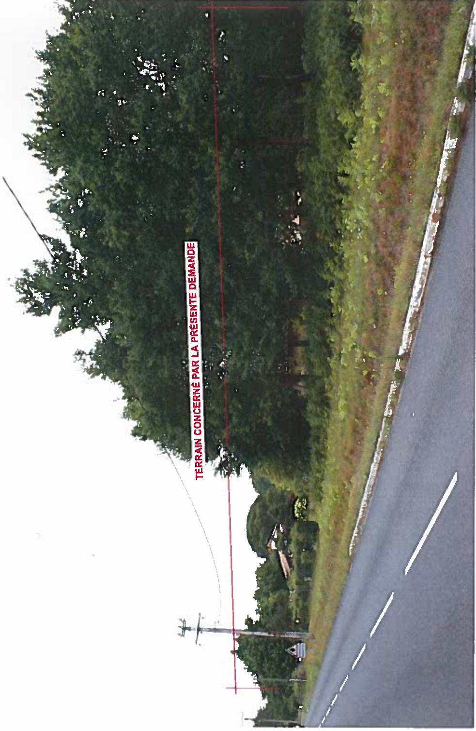
prise de vue le 20 Juillet 2017