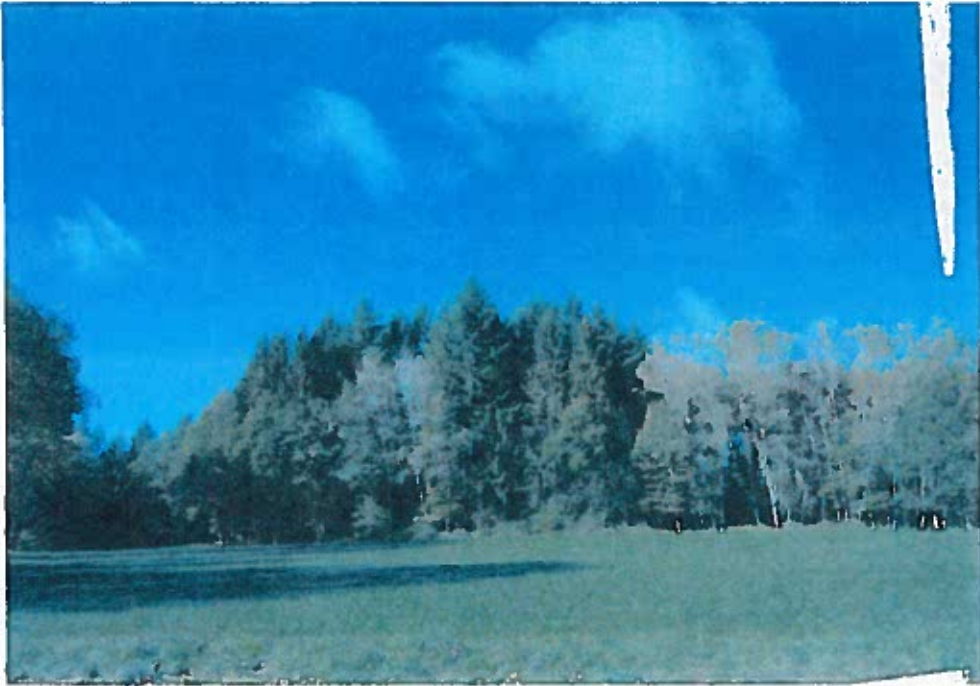
les forêts détruites la route latérale - 1.4.1945