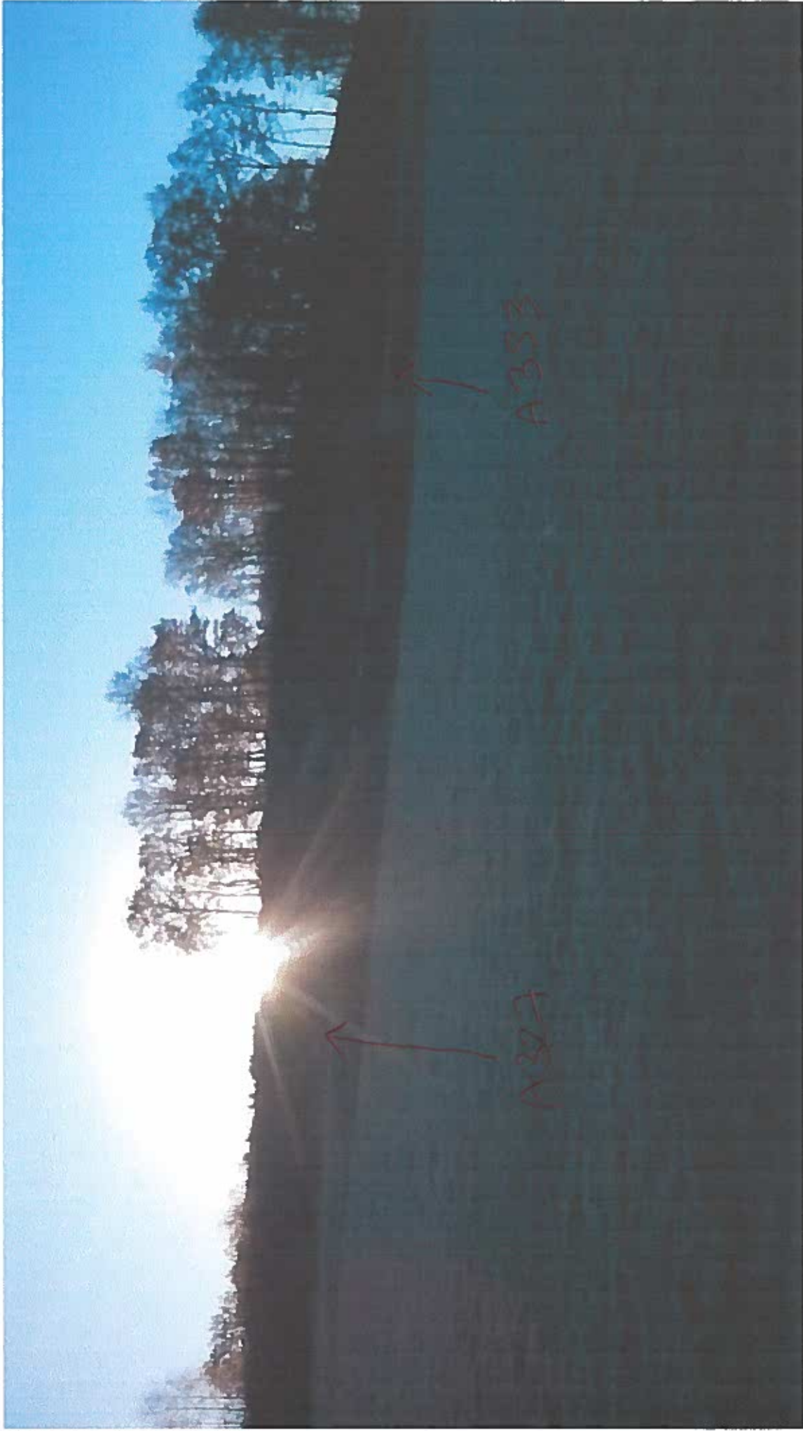
Vue d'en Bas. (côte ouest)