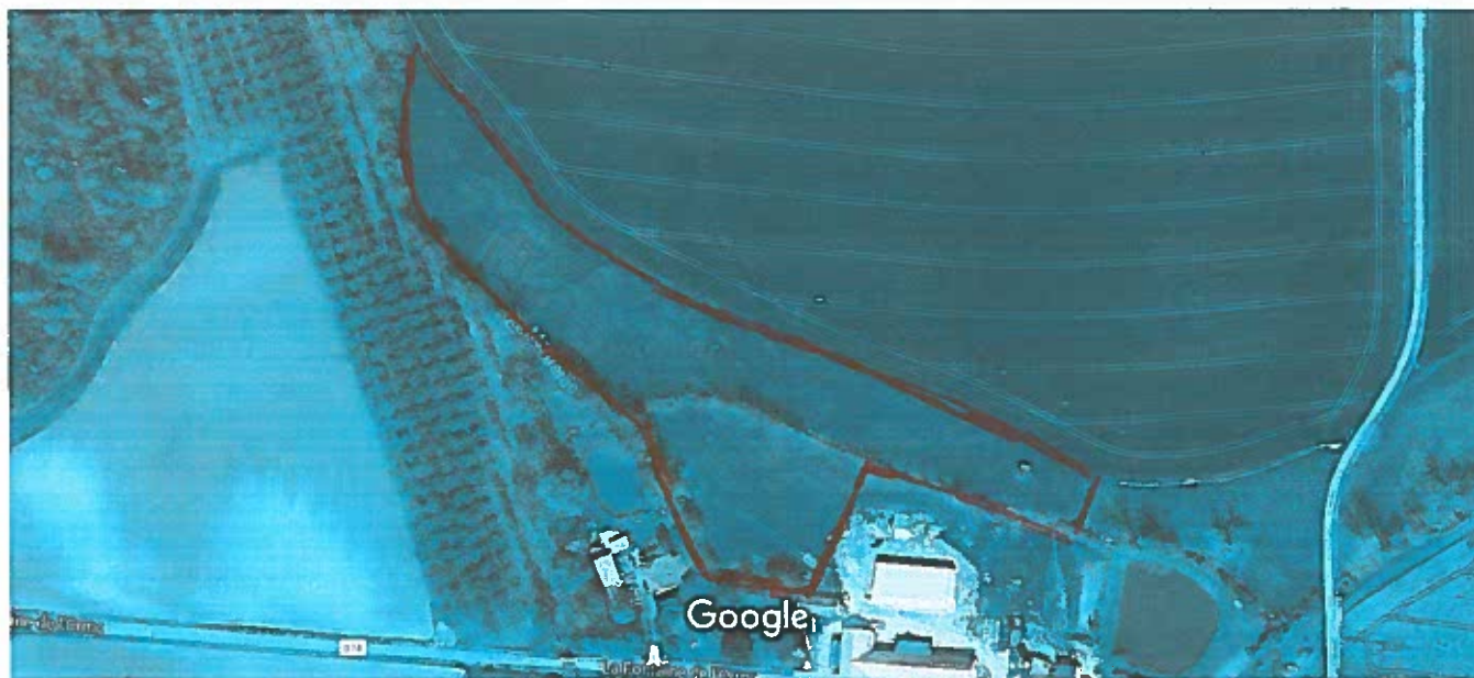
Images ©2017 DigitalGlobe, Données cartographiques ©2017 Google 20 m