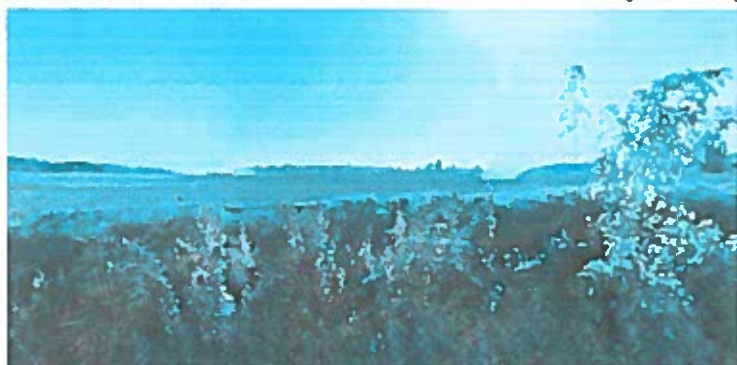
Le Moulin Texier 16190 Deviat

Images ©2017 DigitalGlobe, Données cartographiques ©2017 Google 20 m