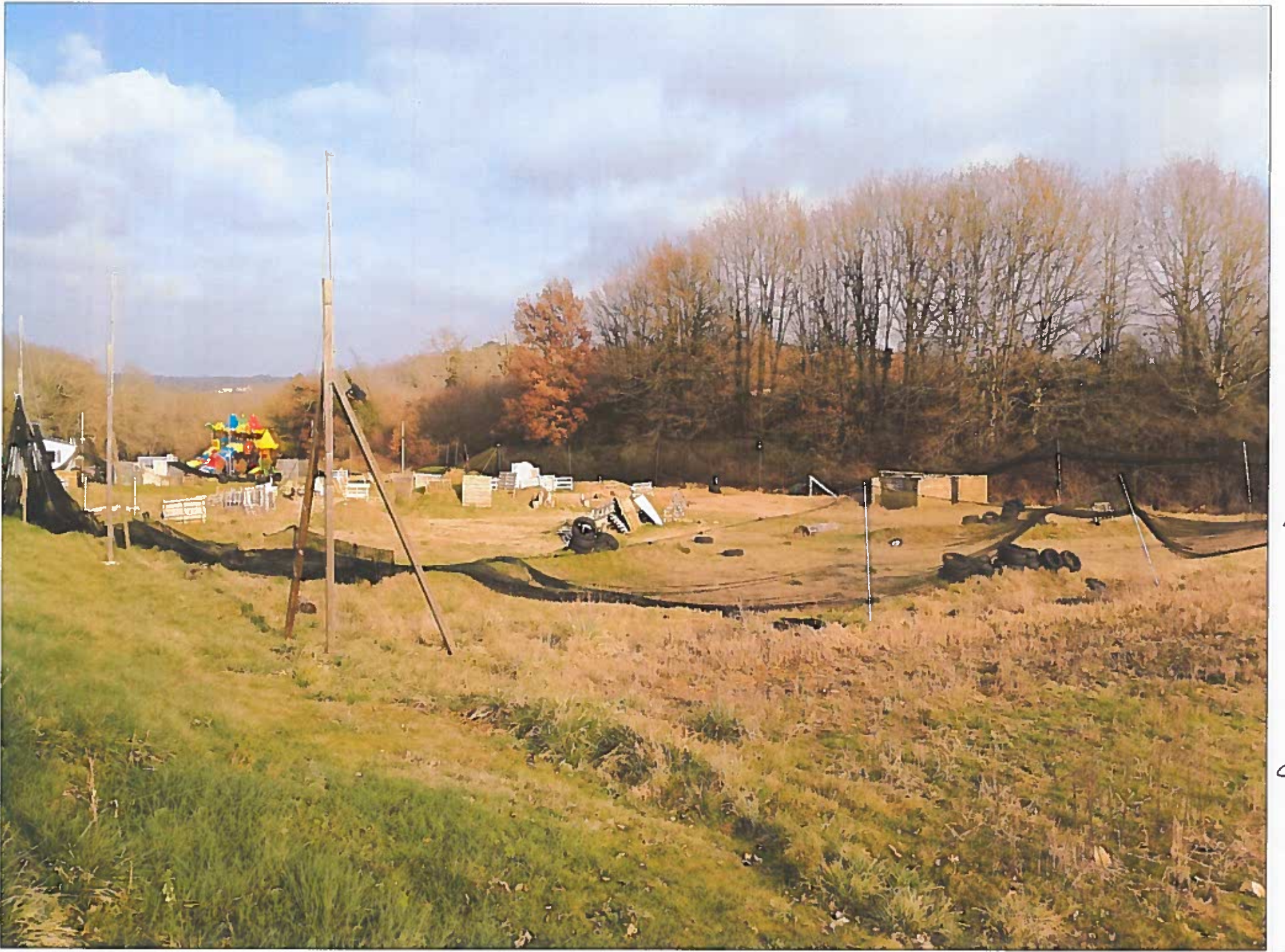
Parcelle 4 1 pour la Zone 1. 12 emplacements