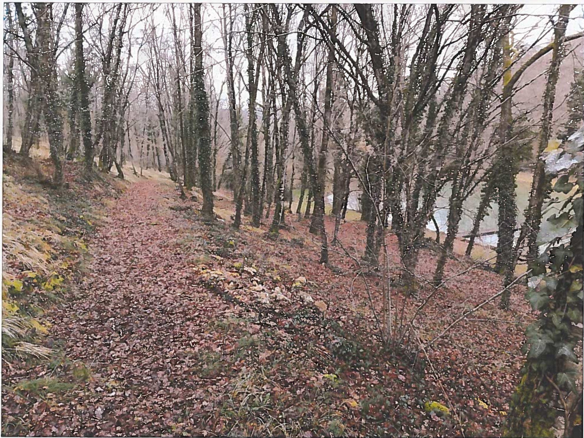
28 eurpface woods