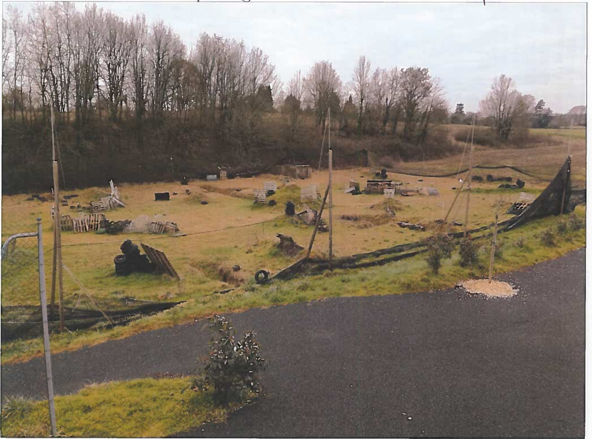
Parcelle 44. seen to Zone 1. 12 emplacements