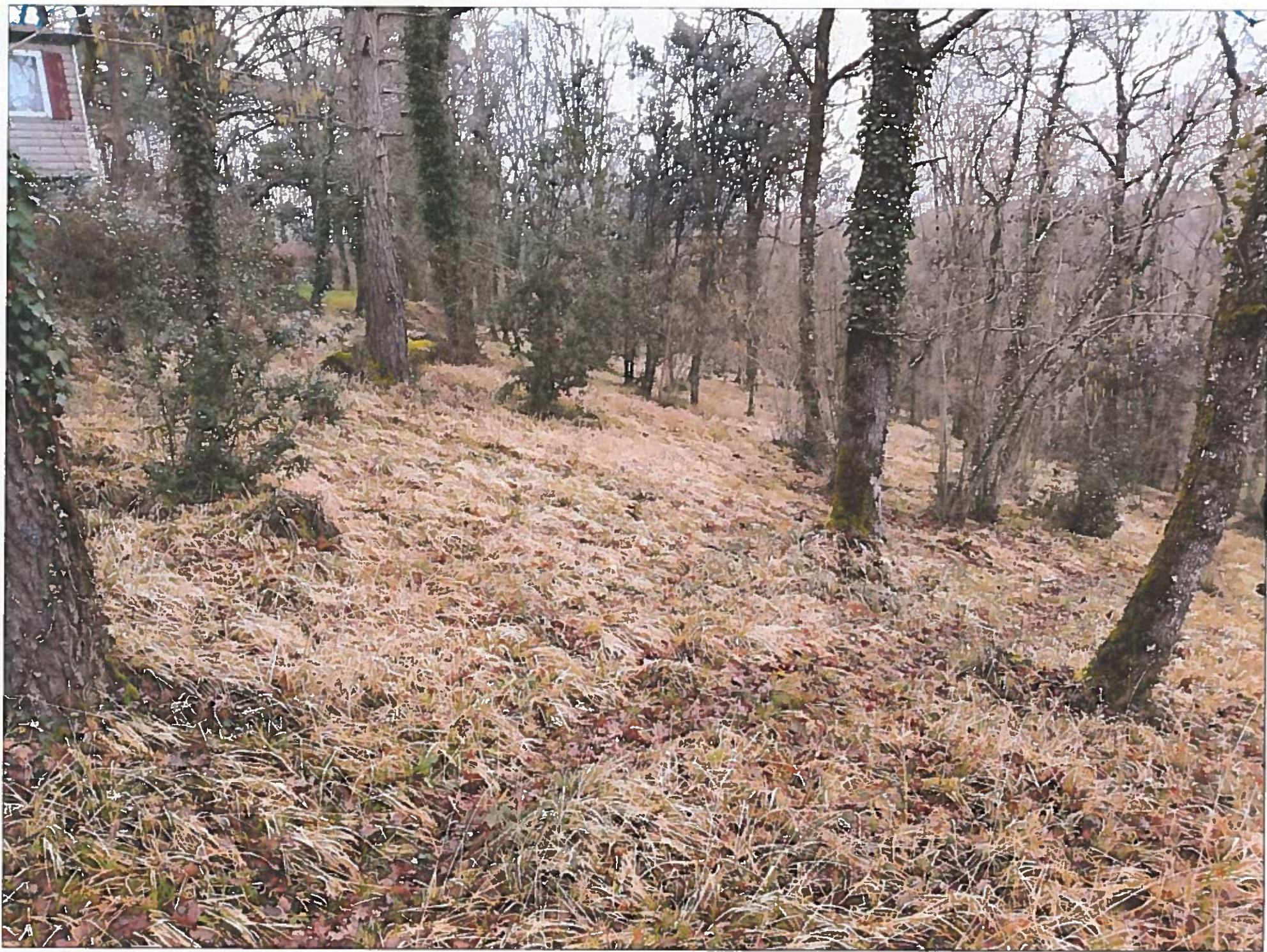
Parcelle 45/46. Zone 2.