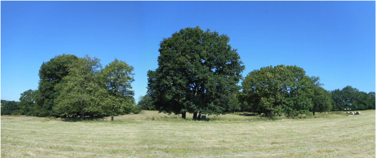
Prise de vue n°3 : Ensemble de chênes formant une haie intérieure, au Nord-Ouest du terrain. La quasi-totalité de ces chênes sera conservée lors de l'aménagement du lotissement.