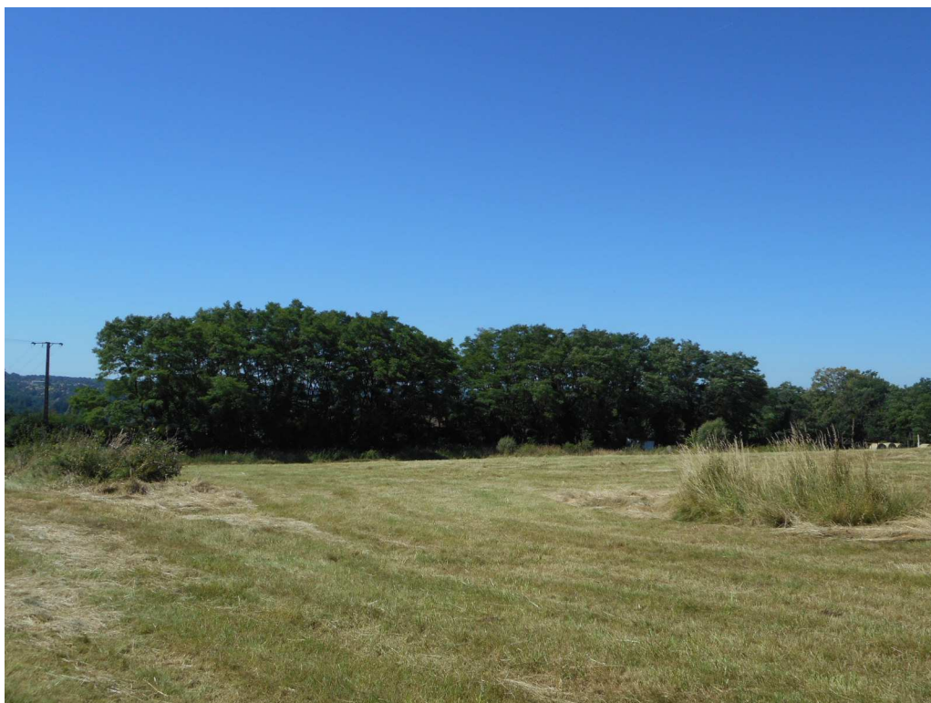
Prise de vue n°8 : Vue de la frange de végétation bordant le terrain du lotissement au Sud, le long de la route de la Treille.