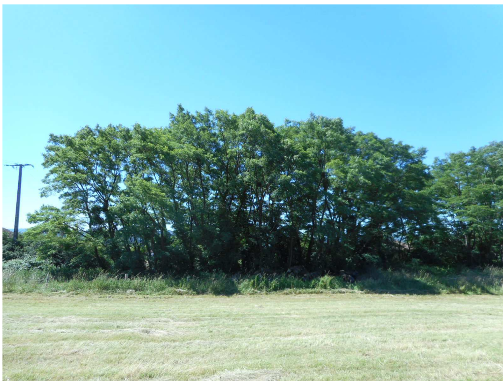
Prise de vue n°9 : Détail de la frange de végétation, bordant le terrain au Sud. Celle-ci est essentiellement constituée d'acacias plantés en haut du talus séparant le terrain de la Route de la Treille.