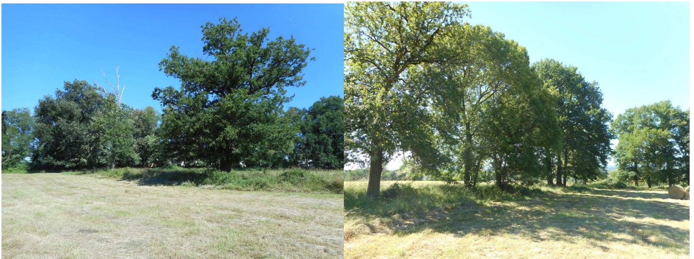
Prises de vues n°4 et 5 : Vue de la haie de chênes.