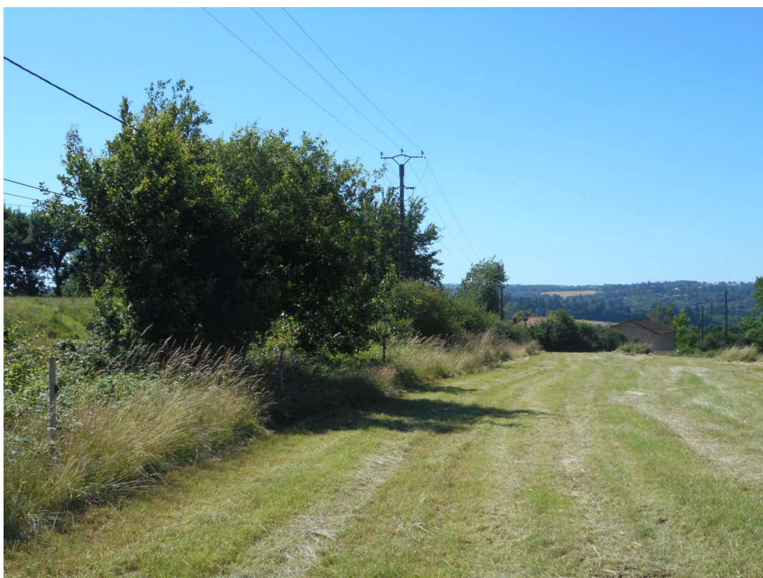
Prise de vue n°7 : Vue de la haie variée existant en haut du talus séparant le terrain de la route de la Chabroulie.