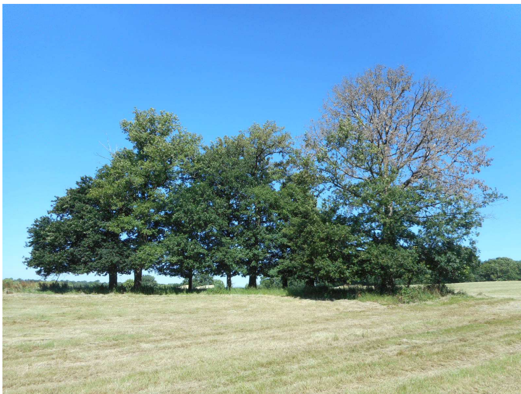
Prise de vue n°6 : Bosquet de chênes existant sur la partie Sud-Est du terrain. Les arbres situés sur la droite, dont un a été foudroyé récemment, seront abattus dans le cadre des travaux d'aménagement du lotissement. Ceux formant une haie linéaire, situés sur la gauche, seront conservés.