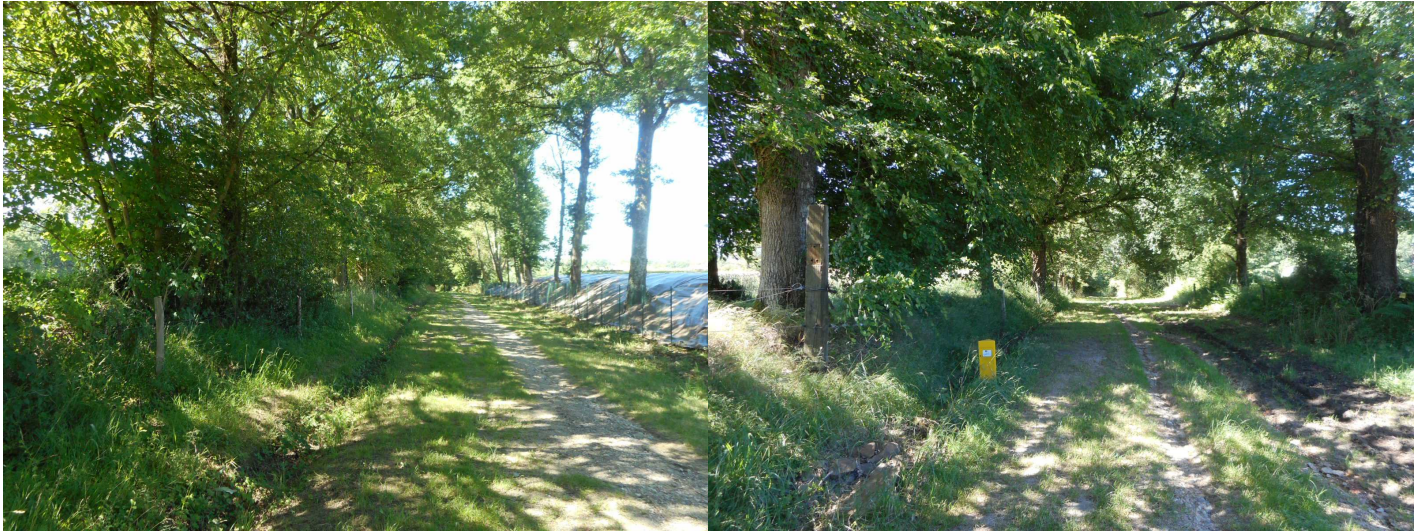
Prises de vues n°1 et 2 : Le chemin de la Comtesse borde le terrain au Nord-Ouest. Il est encadré par 2 allées de grands chênes. Celle située à l'Est sera conservée lors de l'aménagement du lotissement.