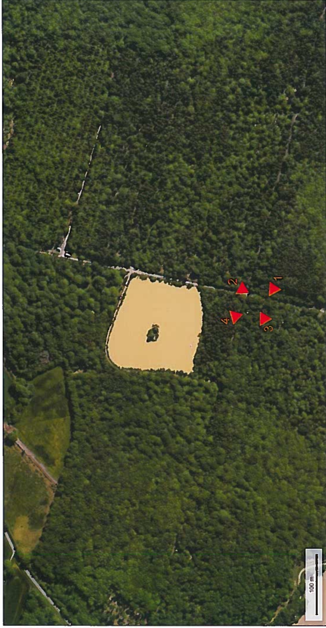
Vue aérienne au 1/5000