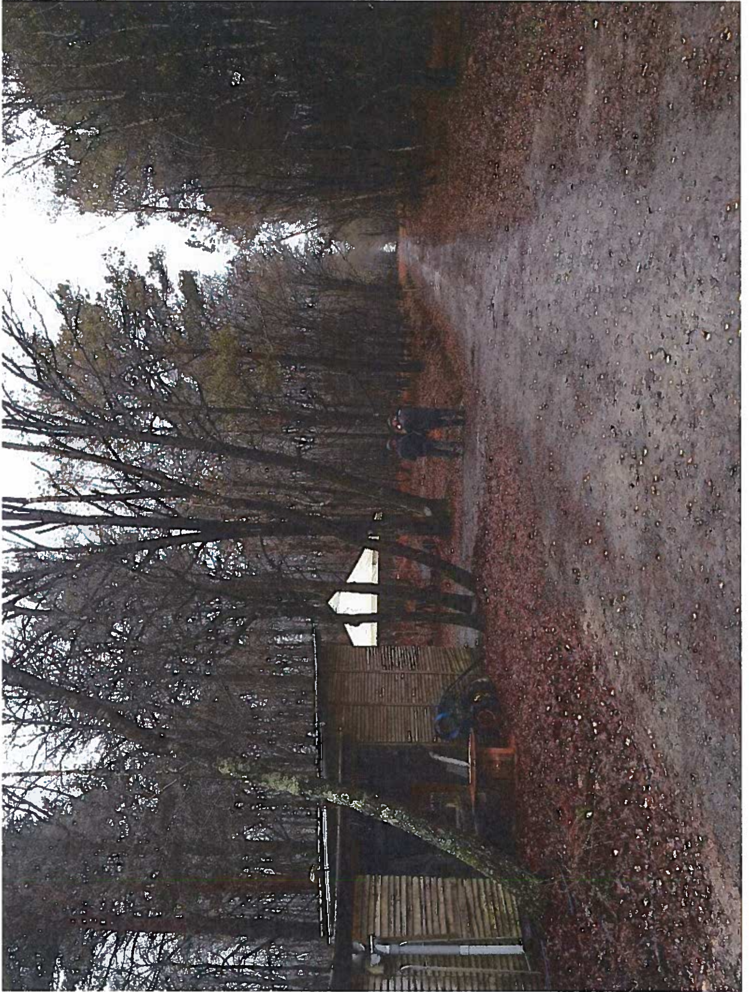
2 Photo no 2