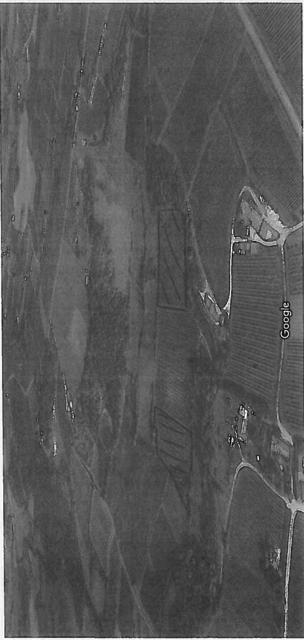
Images ©2019 Google, Data SIO, NOAA, U.S. Navy, NGA, GEBCO, Landsat / Copernicus, Données cartographiques ©2019 Google 50 m